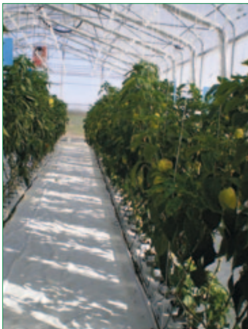
Slika 3. Tvrtka Ekoprom Bešlinec – Zatvoreni sustav, spremnici i UV-sterilizator hranjive otopine