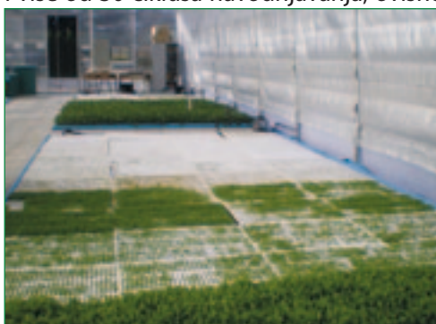
Slika 4. Tvrtka GIS IMPRO Vrbovec – Glavna upravljačka jedinica s grafičkim prikazom klimatskih uvjeta na računalu.