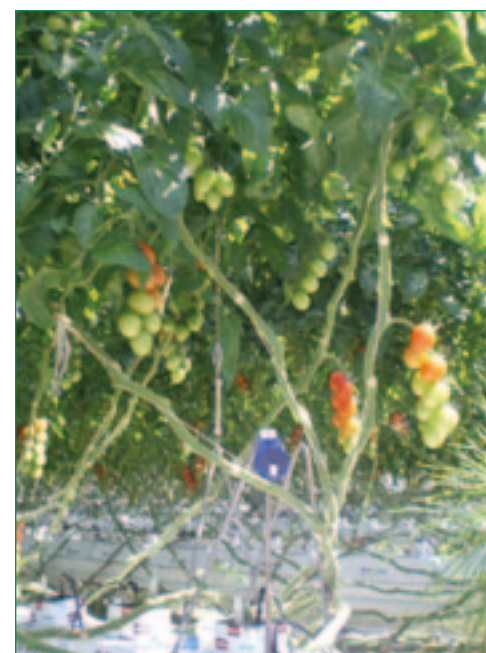
Slika 2. Tvrtka Ekoprom Bešlinec – Spremnici i miješalica za hraniva

mali kapacitet izmjene kationa, što ograničava njihovu moć oslobađanja ili vezanja hraniva, te mogu duže sačuvati svoju strukturu. Od anorganskih supstrata najčešće se koristi kamena vuna, perlit, vermikulit i silikatni pijesak. Kamena vuna je inertni vlaknasti materijal, mješavina vulkanskih stijena, vapnenca i rastaljenog koksa. Kamena vuna je slabo alkalna, inertna i biološki se ne razgrađuje. Pri uzgoju na kamenoj vuni biljka se neophodna biljna hraniva dodaju isključivo putem navodnjavanja. Kamena vuna izrađena je u obliku ploča, blokova ili granulirana. Uzgojni blokovi najčešće se izrađuju s rupama za presadnice, i svaki je blok posebno umotan u foliju. Platenik se prekriva bijelom ili bijelo-crnom folijom po tlu, koja osigurava refleksiju svjetla i dobru higijenu u plasteniku tijekom proizvodnog ciklusa. Prije početka uzgoja, omotane ploče kamene vune se pomoću kapaljke dobro natope hranjivom otopinom. Na gornjoj strani ploče kamene vune naprave se otvori u koje se umetnu uzgojni blokovi brida 7,5 cm s već uzgojenim biljkama. Nakon nekoliko dana korijen iz uzgojnog bloka prorašće kroz taj otvor u ploču kamene vune. Na pločama kamene vune potrebno je sa strane napraviti drenažni otvor među postavljenim biljkama, kako bi se višak hranjive otopine procjeđivao u kanalice. Neposredno nakon presađivanja biljke potrebno je češće navodnjavati. Veliki utjecaj na prinos ima kvaliteta