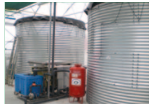
Slika 5. Hidroponski uzgoj paprike na kamenoj vuni - Gospodarska škola Čakovec