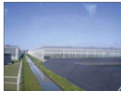
Slika 1. Tvrtka Ekoprom Bešlinec – Hidroponski uzgoj rajčice na kamenoj vuni

Za hidroponsku proizvodnju potrebna su velika početna ulaganja jer se koristi automatizirana oprema, specijalna gnojiva, visoka kvaliteta supstrata, pa je stoga potrebno uzeti u obzir potrebe tržišta, kvalitetu i cijenu gotovog proizvoda. Izbor uzgojnog medija ovisi o klimatskim uvjetima, tipu plastenika i hidroponskoj metodi. Supstrat mora sadržavati dovoljno vode, hraniva i zraka za sustav korijena, ne smije sadržavati nikakve toksične tvari i mora biti jednostavan za rukovanje. Supstrati za uzgoj mogu biti organski, anorganski i sintetički supstrati. Organski supstrati (treset, kompost, drveno vlakno, kokosovo vlakno) dobro drže vodu, ali mijenjaju fizikalna svojstva. Anorganski supstrati imaju