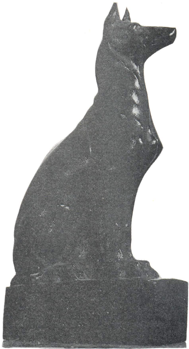
Faraonski pas, bez datuma, vlasništvo: Petar Dešković u Splitu.

talogu te izložbe nabrojeno je još jedno djelo: Vrijeme za zob. Oba su nestala, iako su bila izložena u Parizu i 1919. godine, a sačuvala su nam se samo njihove fotografije.