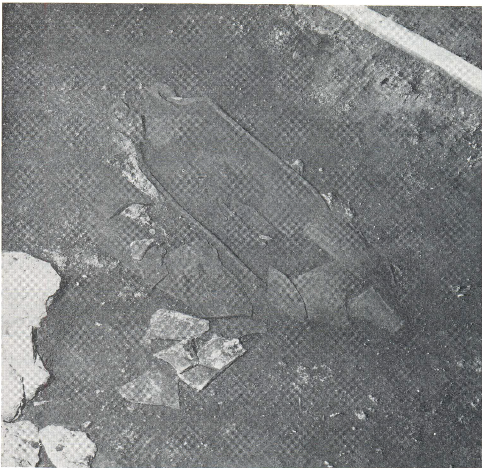
Grob 3. u amfori. Snimio: Z. Buljević

Sačuvane amfore iz groba 1. i 3. pružaju mogućnosti rasprave o njihovoj tipologiji i dataciji. Obje amfore pripadaju istom tipu, koji je karakteriziran dugim cilindričnim trbuhom s kraćom ili dužom cilindričnom nožicom, manjim ljevkastim grlom, koje je prošireno prema trbuhu te zaobljenim ili ravnim obodom. Ručke su male i zaobljene i nerijetko kanelirane po sredini. Veličina ovog tipa amfore doseže i do 110 cm (crtež 1). Ovaj tip amfora Dressel je uvrstio u svoju tipološku klasifikaciju pod br. 26, dok je N. Lamboglia amfore ovog tipa, pronađene na nalazištu kod otoka Gallinaria, datirao u kasni rimski period, 2) F. Benoît ih svrstava u svoju tipologiju pod br. 27, navodeći da su se amfore pronađene kod Saint-Andre kod Agda, upotrebljavale za sahranjivanje. 3) M. Almagro također smatra da se ovaj tip upotrebljavao za sahranjivanje na nekropoli u Ampuriasu i klasificira ih kao tip 26 A, B, C. 4) B. Lloris ih datira od 250. do 370. g. n. e. 5)