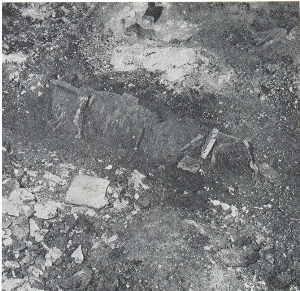
Grob 2. s tegulama.