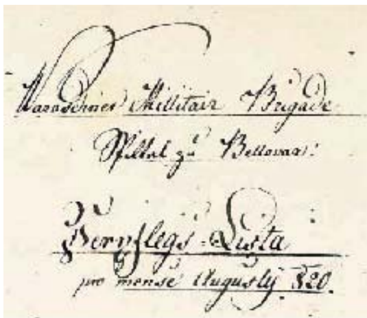
Slika 4. Naziv bjelovarske bolnice iz 1820. godine