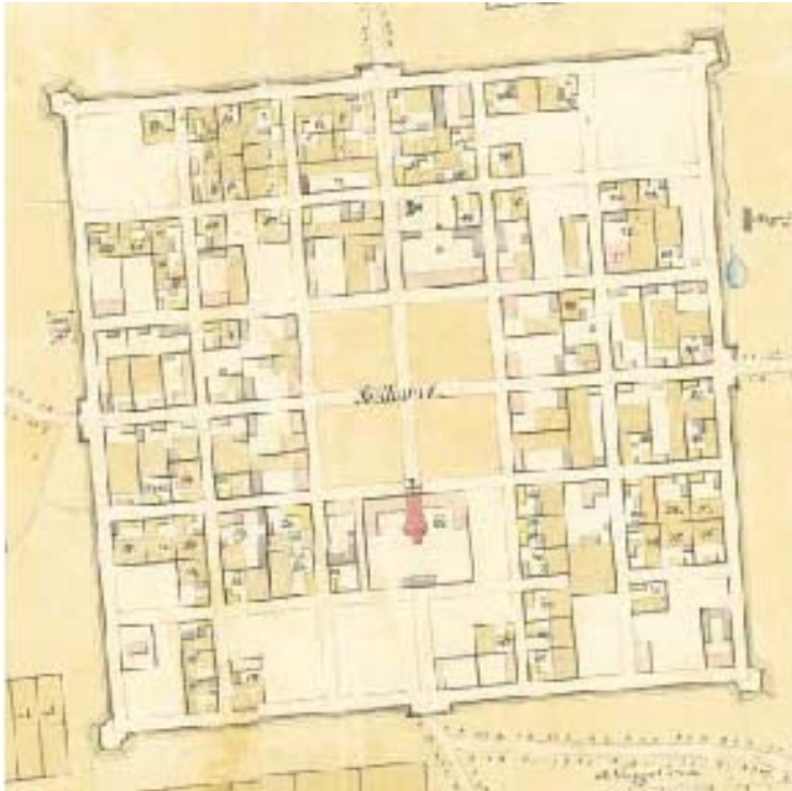
Slika 1. Najstariji plan grada Bjelovara iz 1772. godine s ucrtanim vojnim zgradama u unutrašnjemu gradu (crvenom bojom)

skrblivala, odnosno brigadne bolnice ( Warasdiner Militair Brigade Spittal zu Belovar ), koji će ostati sve do razvojačenja. Prema Zemljišnoj knjizi bjelovarskoga komuniteta od 27. travnja 1787., upisana je Državna (erarska) bolnica zajedno s dvorištem i stajom te povrtnjakom (za potrebe kuhinje) na čestici br. 192. ( Aerarial Spittalhaus samt Hof und Stall, dabey ein Kuchelgarten ) [1,2,9].