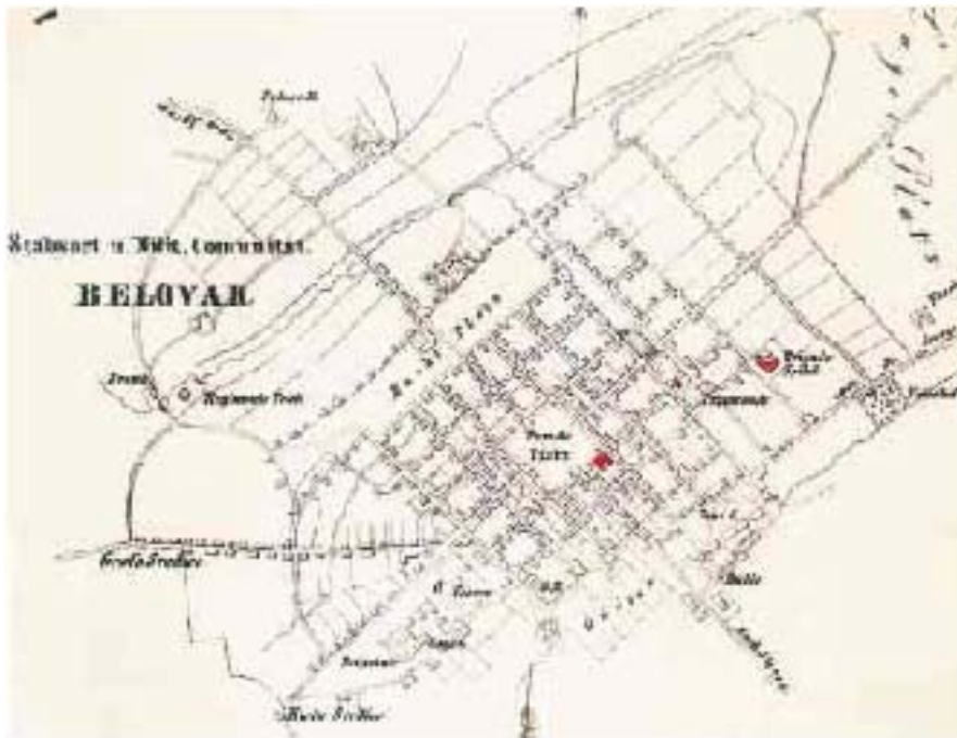
Slika 5. Plan Bjelovara iz 1853. godine s ucrtanom zgradom nove Brigadne bolnice ( Brigade Spital )

odobrava se gradnja nove Brigadne vojne bolnice, a gradnja je počela 1843./1844. godine na zemljištu Đurđevačke pukovnije gdje su bili vrtovi bjelovarskih časnika. Bolnička zgrada podignuta je 1845. godine. Bolnica je nosila naslov Landes Spital der k. und k. Warasdiner Militaer Grenze , nazivana je i Brigadnom bolnicom ( Brigade Spital ), a prvi spomenuti naslov stoji i danas na zgradi bolnice [1,13,16].