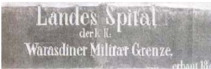
Slika 6. Ploča s nazivom iz 1845. godine koji stoji i danas na zgradi bolnice