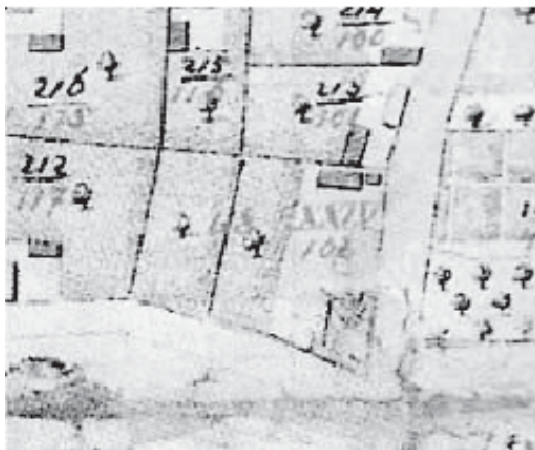
Slika 3. Isječci iz plana Bjelovara iz 1828. godine s ucrtanom bolnicom pod br. XXIV. Aerial Spittal

Tijekom ranih 90-ih godina 18. stoljeća bolnica se premješta u novoizgrađenu zgradu, također izvan gradskih bedema, gdje djeluje do polovice 19. stoljeća. Na postojećim i znanim planovima grada iz 1792., 1822. i 1828. godine bolnička je zgrada ucrtana na uglu današnje Jelačićeve ulice i Šetališta dr. Ivše Lebovića. Na prvom je planu pod br. 12. upisana kao Militair und Burger Spittal (Vojna i gradska bolnica), a na planu grada iz 1828. obilježena je rimskim brojem XXIV. kao Aerial Spittal (Državna bolnica). Prema navedenim planovima, bolnica je smještena na većem pravilnom zemljištu s dvije strane omeđena ulicama s arteškim zdencom u dvorištu, a kasnije se dograđuje još jedan krak uza zgradu te dvorišne prostorije, koje su vjerojatno bile mrtvačnica i skladište prema tadašnjim planovima izgradnje bolnice. Tu će bolnica djelovati sve do polovice 19. stoljeća [1,2,11,12].