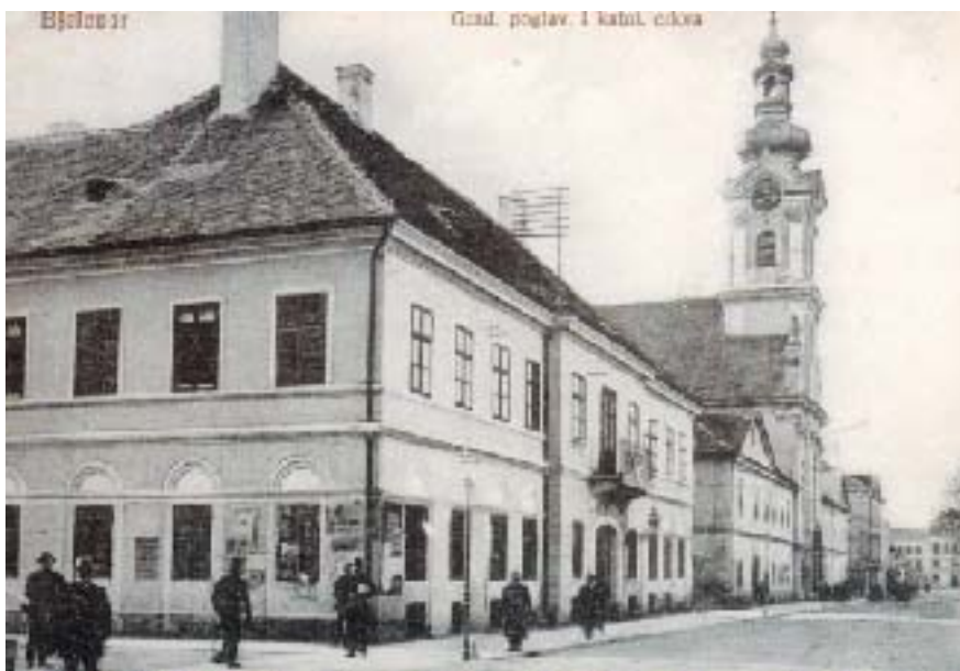
Slika 1. Izgled zgrade Gradskoga poglavarstva u Bjelovaru u vrijeme susreta cara i biskupa u njezinoj svečanoj dvorani (s balkonom) na prvom katu

Već prvoga dana njegova boravka u Bjelovaru, nakon kratkog odmora, u zgradi tadašnjega Gradskog poglavarstva u svečanoj dvorani na prvom katu Franjo Josip I. počeo je primati deputacije, među kojima su se nalazili tajni savjetnici njegova Veli-