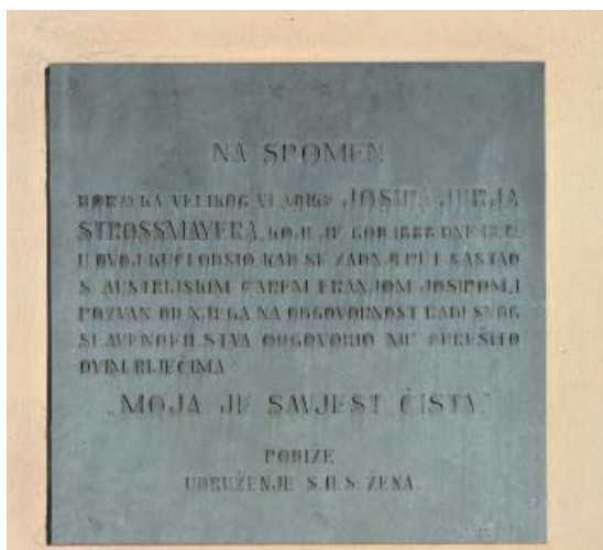
Slika 4. Spomen-ploča Strossmayeru postavljena 1924. godine

Potvrda tome jest i to da su i „bjelovarske dame“ inicirale podizanje spomen-ploče i da su u tome doista uspjele. Doduše, vidjeli smo, ne bez problema, ali ploča nas i danas, zahvaljujući isključivo njima, podsjeća na osobu koja se svrstava u red velikana hrvatske povijesti 19. stoljeća 8 , čija je veličina „nadišla i prerasla usko nacionalne i pretočila se u europske okvire“ (Matoš). Još jedan dokaz da je naš stari marijaterzijanski gradić između dva svjetska rata bio pravi mali europski grad. 9