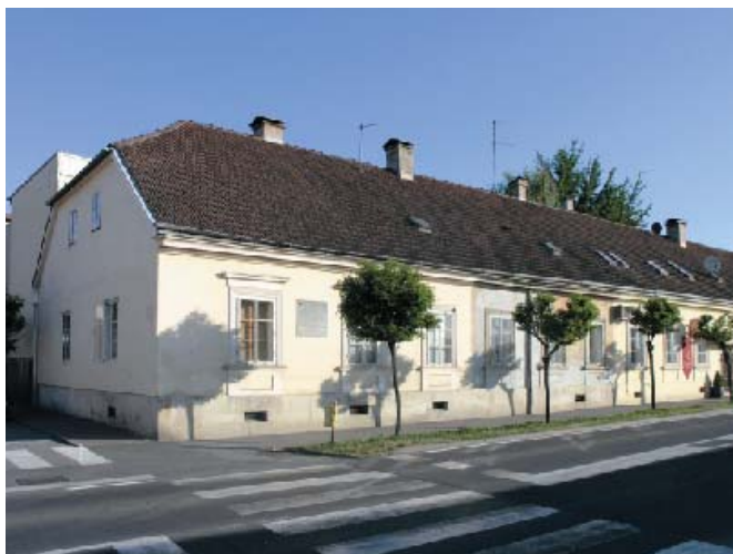
Slika 3. Zgrada na Banskom trgu u Bjelovaru (danas Trg Hrvatskog sokola 11)

Dakle, punih 36 godina nakon spomenutog događaja, u znak sjećanja na Strossmayerov boravak u Bjelovaru i njegovo hrabro držanje pred carem, bjelovarsko Udruženje žena SHS (Udruženje Srba, Hrvata i Slovenaca) postavilo je 1924. godine na istočno pročelje zgrade Imovne općine đurđevačke na Banskom trgu (danas Trg Hrvatskog sokola br. 11), gdje je tada – u peterosobnom stanu šumara