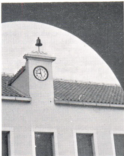
Sat na tornju zgrade stare bolnice

Satovi su kupljeni od švicarske tvornice Indukta iz Thun-Gwatta. Stigli su u rujnu, ali je montaža zbog kvara glavnog sata u Pošti kasnila. Prvi je postavljen na metalnom kandelabru neonske rasvjete na raskršću