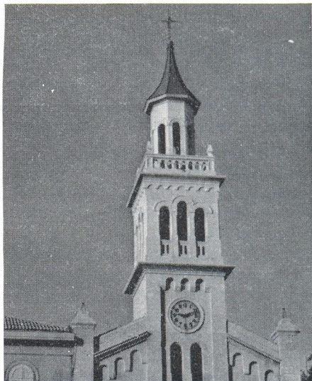
Sat na tornju crkve sv. Frane

Ulice prvoboraca i I. L. Libara dana 22. prosinca. Montirali su ga radnici Elektrodalmacije i splitskog poduzeća PTT. Ostalih pet satova montirano je do kraja godine na mjestima po gradu gdje su dosta uočljivi: u luci kod Gata proleterskih brigada, kod zgrade Pravnog fakulteta, na raskršnici Maksima Gorkog i Zrinjsko-Frankopanske, u Ulici sinjskih žrtava kod robne kuće »Prima« te kod bolnice na Firulama. Na svakom od ovih mjesta na željeznom stupu je stavljen sat u obliku kocke s 4 brojčanika na bočnim plohamama. Čitav sistem radi sinhronizirano. U zgradi Pošte nalazio se matični elektronični sat koji je svake minute davao električni impuls. Preko razdjelnika i telefonskih kablova impuls se prenosi na sporedne satove gdje magnet pomakne kazaljke. Za nabavku i montažu utrošeno je 20 000 dinara.