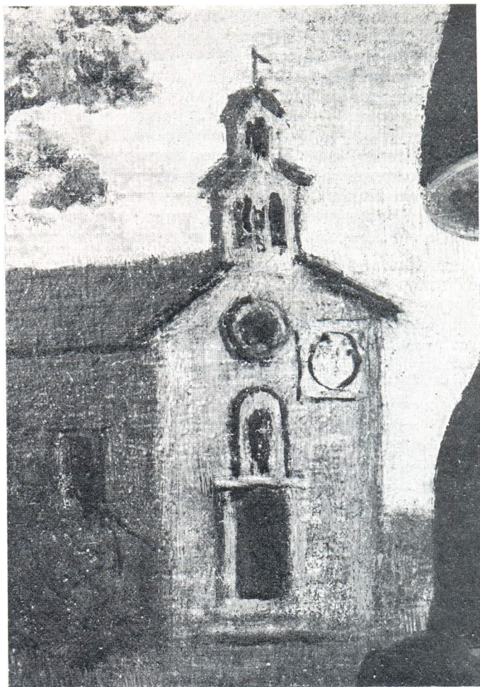
Crkva sv. Roka na Lučcu sa satom na pročelju. Detalj sa slike sv. Roka iz druge polovice 19. stoljeća.

U prošlom ratu 1944. godine porušene su bombardiranjem iz zraka crkva sv. Petra i Režija duhana. Njihovi ostaci uklonjeni su poslije oslobođenja u periodu 1946—47. godine. Stradali su i satovi koji su bili na ovim zgradama, tako da su u čitavom gradu ostala još samo dva, i to na crkvi sv. Frane i Narodnom trgu. No nedugo zatim postavljen je novi sat na novoj autobusnoj stanici koja je izgrađena 1948. na raskršću Radničkog šetališta i ulice Žrtava fašizma. Budući da se tu okupljalo mnogo putnika, na južnom pročelju zgrade pred čekaonicom, namješten je manji sat četvrtastog oblika. Kako je deset godina kasnije premještena na Obalu bratstva i jedinstva, sat je zapušten, nije išao pa je neko vrijeme poslije skinut.