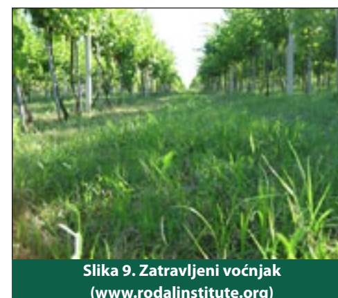
Slika 9. Zatravljeni voćnjak (www.rodalinstitute.org)

za zatravljivanje višegodišnjih nasada koja privlači Syrphidae te neke vrste parazitskih osica iz obitelji Scoliidae i Tiphidae . U kalifornijskim vinogradima heljda posebno privlači parazitske osice roda Anagrus spp. koji su jajni paraziti nekih štetnih cikada vinove loze. Osim toga nadzemni biljni pokrivač pruža sklonište predatorskim stjenicama roda Geocoris (Bugg i sur. , 1990.). Altieri i sur. , (2005.) donose rezultate istraživanja iz kanadskih voćnjaka jabuke prema kojima je 4 do 18 puta više štetnika parazitirano kada unutarnju ekološku infrastrukturu istog čine biljne vrste poput divlje mrkve, pastirnjaka i predstavnika roda Ranunculus .