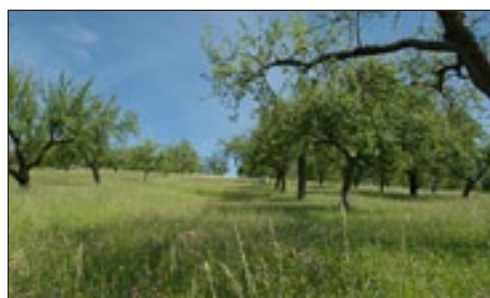
Slika 4. Livada - voćnjak

sklonište, poboljšavaju reproduktivnu sposobnost kod božjih ovčica (bubamara) kada se iste hrane na cvjetovima prethodno navedenih vrsta (Burgio i sur. , 2004.). U prethodnom tekstu prikazana su neka pozitivna obilježja živice, međutim treba spomenuti i neka njihova negativna svojstva. Naime, u vlažnim i hladnim mikroklimatima živice stvaraju sjenu i dodatno povećavaju sadržaj vlage, posebno jutarnje rose. Ako su preblizu proizvodnoj površini, natječu se s usjevom u zoni korijena za vodu i mineralne tvari pa bi stoga udaljenost od nasada trebala iznositi minimalno 5 m. Mogu biti domaćini nekim bolestima, npr. Juniperus spp. , patogenoj gljivi koja na kruški uzrokuje bolest Kruškin pikac, dok je Berberis vulgaris L. prijelazni domaćin žitnim hrđama. Lonicera spp. domaćin je trešnjinoj muhi, a Prunus spinosa L. leptiru Boarmia rhomboidaria Schiff., štetniku na vinovoj lozi. Živice smanjuju proizvodnu površinu koja je u poljoprivrednoj proizvodnji ionako nedostatna u odnosu na neproizvodnu. Prema preporukama IOBC-a (International organization for biological and integrated control of noxious animals and plants), ekološka bi