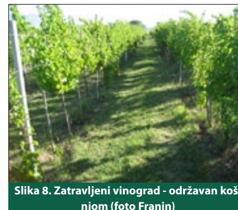
Slika 8. Zatravljeni vinograd - održavan košnjom