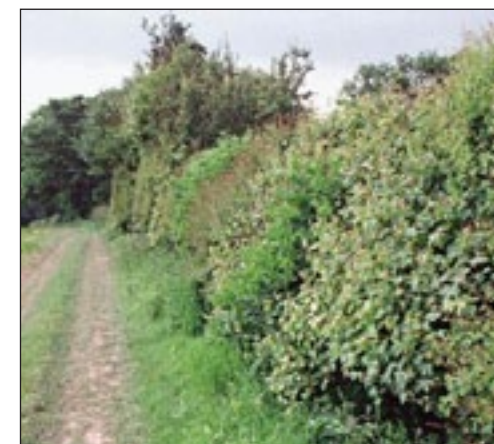
Slika 1. Prirodna živica

Prema definiciji, živice se sastoje od nekoliko različitih slojeva vegetacije koji uključuju grmove, bočne travnate trake, a ponekad i stabla. Dodatne, odnosno pomoćne komponente mogu biti nakupine kamenja, šikare ili gustiši te suhozidi (Slika 3). S agronomskog gledišta, živice, osim zaštite i izvora hrane za prirodne neprijatelje, osiguravaju zaštitu protiv erozije, pogotovo ako su površine na nagnutim položajima. Predstavljaju vjetrozaštitni pojas, smanjuju eroziju vjetrom i evapotranspiraciju (Boller i sur., 2004). Osim prethodno navedenog, neki autori smatraju da žive ograde umanjuju zanošenje „drift“ kemijskih sredstava za zaštitu bilja i mineralnih gnojiva te djelomično filtriraju inokulum patogenih mikroorganizama i tako smanjuju moguće infekcije kulturnog bilja. Živice su ključna komponenta u bioraznolikosti nekog ekosustava te imaju važnu ulogu prilikom biološkog suzbijanja štetnika jer su