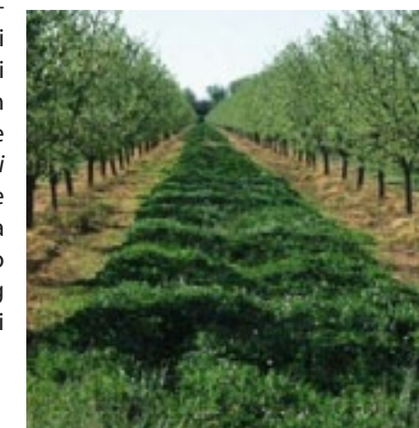
Slika 10. Rubni dio proizvodne površine maslinika

Zeleni pokrivač u vinogradu ili voćnjaku predstavlja svojevrsnu unutarnju ekološku infrastrukturu te ima višestruku funkciju (Slika 8). Osim što privlači i akumulira faunu korisnih organizama, obogaćuje tlo organskom tvari, smanjuje negativni učinak erozije ako se nasad nalazi na nagnutoj površini, sprječava gubitak vlage iz tla, a ovisno o vrsti biljnog pokrova, npr. biljke iz porodice Fabaceae , može fiksirati dušik iz zraka. Takve se površine održavaju košnjom prilikom koje je preporučljivo koristiti horizontalne kosilice umjesto rotacionih jer se na taj način najmanje šteti korisnim organizmima koji se zadržavaju neposredno iznad površine tla, npr. pauzi ( Aranea ), trčci ( Carabidae ) i neke vrste stjenica (Heteroptera). Bitna je i visina otkosa koja bi trebala iznositi najmanje 8 cm, iako bi bilo optimalno od 10 do 12 cm visine (Boller i sur. , 2004.). U svom istraživanju Bugg i Dutcher (1989.) navode heljdu ( Fagopyrum esculentum Moench) kao pogodnu vrstu