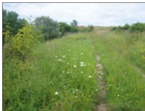
Slika 11. Oranica prepuštena samonikloj flori

Ugar ili odmor tla sastavni je element plodoreda. Osim tzv. crnog ugara koji pretpostavlja nezasijano, odnosno samo obrađeno tlo, postoji i zeleni ugar, dakle površina zasijana određenim biljnim vrstama, uglavnom krmnim. Bitno je da u sastavu flore budu zastupljene biljke koje brzo razvijaju zelenu masu i sprječavaju zakorovljivanje površine. U tom slučaju prednost dajemo biljkama kao što su heljda ili lucerna te nekim drugim vrstama mahunarki. Takve se površine zasijavaju od rujna do travnja, a kose isključivo od listopada pa do ožujka. Ne gnoje se, a herbicidi se primjenjuju ako postoje problemi s korovima. Osim ciljanog uzgoja određenih vrsta, neobrađenu površinu možemo prepustiti samonikloj flori, što se posebno preporučuje na hranjivima siromašnim tlima (Slika 11.). Za razliku od ostalih tipova ekološke infrastrukture, ugar već prvu godinu pokazuje rezultate u smislu privlačenja velikog broja pauka, korisnih kukaca (predatorske stjenice i trčci) te ptica i manjih sisavaca. Negativna karakteristika može biti porast populacije puževa i miševa (Boller i sur. , 2004.).