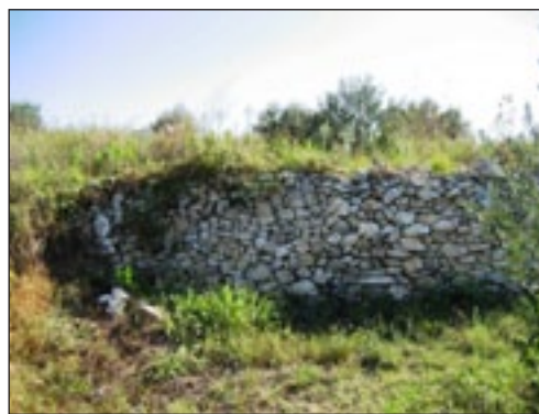
Slika 3. Suhozid

sklonište, poboljšavaju reproduktivnu sposobnost kod božjih ovčica (bubamara) kada se iste hrane na cvjetovima prethodno navedenih vrsta (Burgio i sur. , 2004.). U prethodnom tekstu prikazana su neka pozitivna obilježja živice, međutim treba spomenuti i neka njihova negativna svojstva. Naime, u vlažnim i hladnim mikroklimatima živice stvaraju sjenu i dodatno povećavaju sadržaj vlage, posebno jutarnje rose. Ako su preblizu proizvodnoj površini, natječu se s usjevom u zoni korijena za vodu i mineralne tvari pa bi stoga udaljenost od nasada trebala iznositi minimalno 5 m. Mogu biti domaćini nekim bolestima, npr. Juniperus spp. , patogenoj gljivi koja na kruški uzrokuje bolest Kruškin pikac, dok je Berberis vulgaris L. prijelazni domaćin žitnim hrđama. Lonicera spp. domaćin je trešnjinoj muhi, a Prunus spinosa L. leptiru Boarmia rhomboidaria Schiff., štetniku na vinovoj lozi. Živice smanjuju proizvodnu površinu koja je u poljoprivrednoj proizvodnji ionako nedostatna u odnosu na neproizvodnu. Prema preporukama IOBC-a (International organization for biological and integrated control of noxious animals and plants), ekološka bi