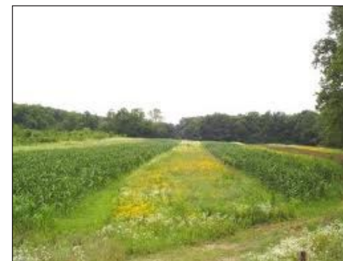
Slika 5. Traka divljeg cvijeća u nasadu

infrastruktura trebala iznositi najmanje 5% od ukupne površine pod kulturom (Boller, 2004.).