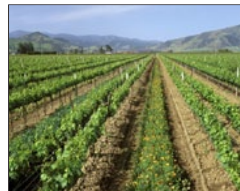
Slika 7. Cvjetna traka unutar vinograda - ciljano uzgajana (www.illustrationsource.com)