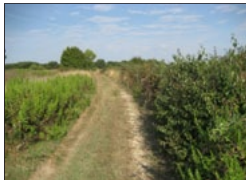
Slika 2. Prirodne živice