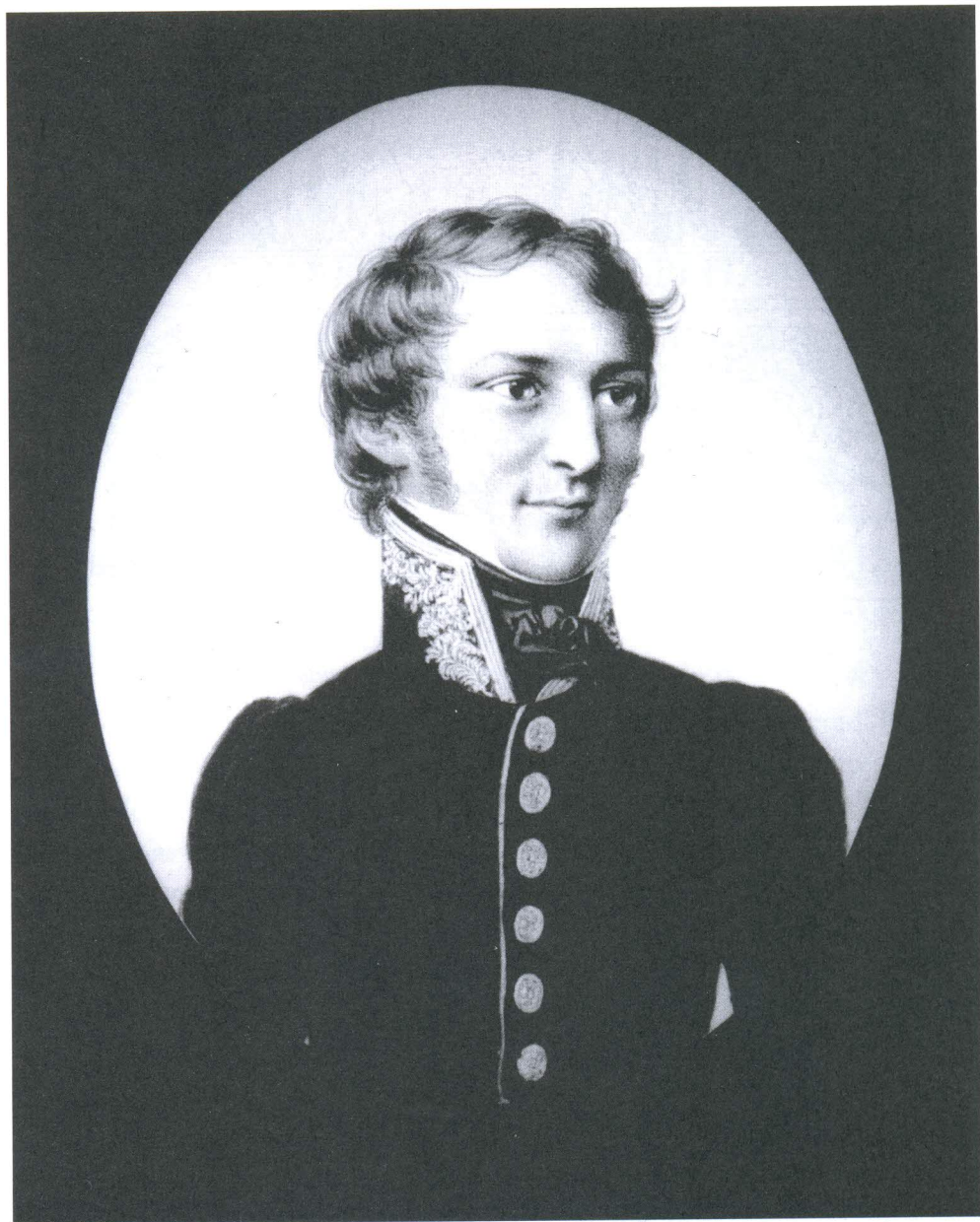
Nepoznati autor: Portret Antona Steinbüchela