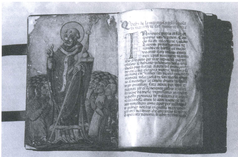
Pravilnik bratovštine pomoraca sv. Nikole

The paper analyzes the already known facts about the seafarers' fraternity of St. Nicholas from Split, or the facts that can be associated with it. It has thus been determined that the fraternity was founded in 1349 with its seat in the church of St. Nicholas on Marjan. Documents from 1361 and 1362 refer to it as Sancti Nicholai de Serra . The fraternity remained in the church on Marjan until the 1460s when it moved within St. Clare's monastery at Sdorij in Diocletian's Palace. As such it was granted permission by provincial father Ivan Soffio from Trieste and the Poor Clares to use the St. Nicholas church near the monastery. This is when the manuscript of the fraternity codex rulebook appeared where it was referred to as St. Nicholas de Sdoria . The fraternity existed probably until the mid 18 th c. when it ceased. Its preserved inventory, apart from the codex, includes the painting of St. Nicholas from the fraternity altar in St. Clare's church, the silver procession cross, wooden ballot box and a tombstone of the fraternity grave.