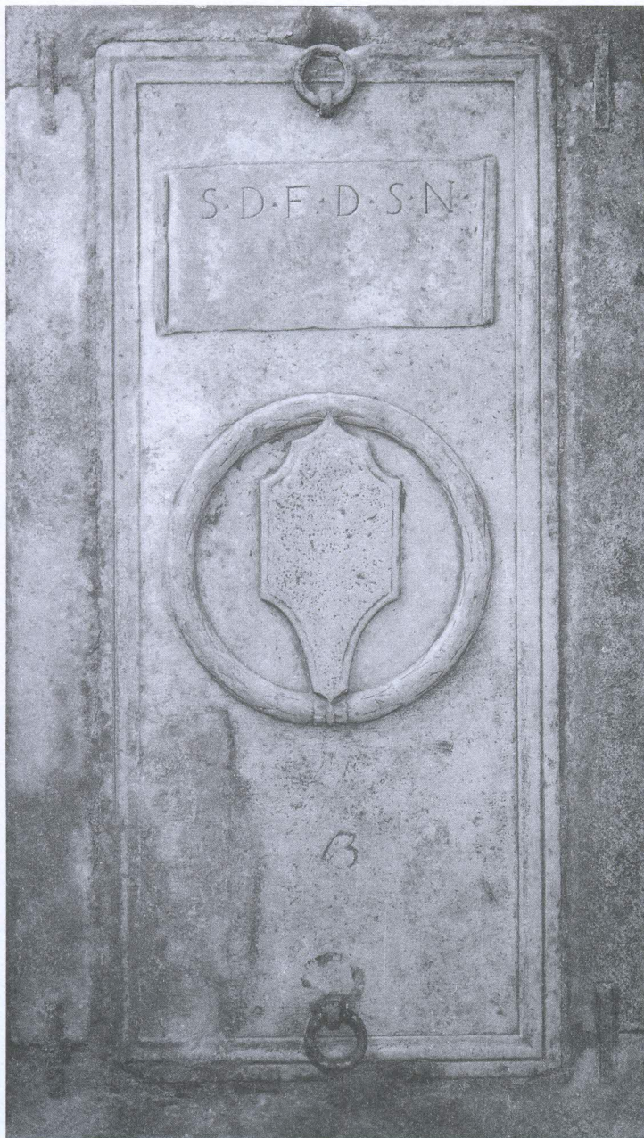
Nadgrobna ploča bratovštine pomoraca