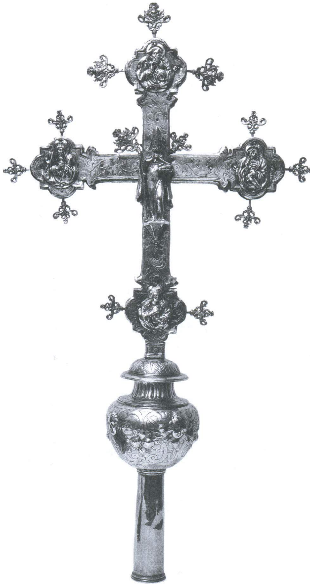
Lik sv. Nikole na ophodnom križu