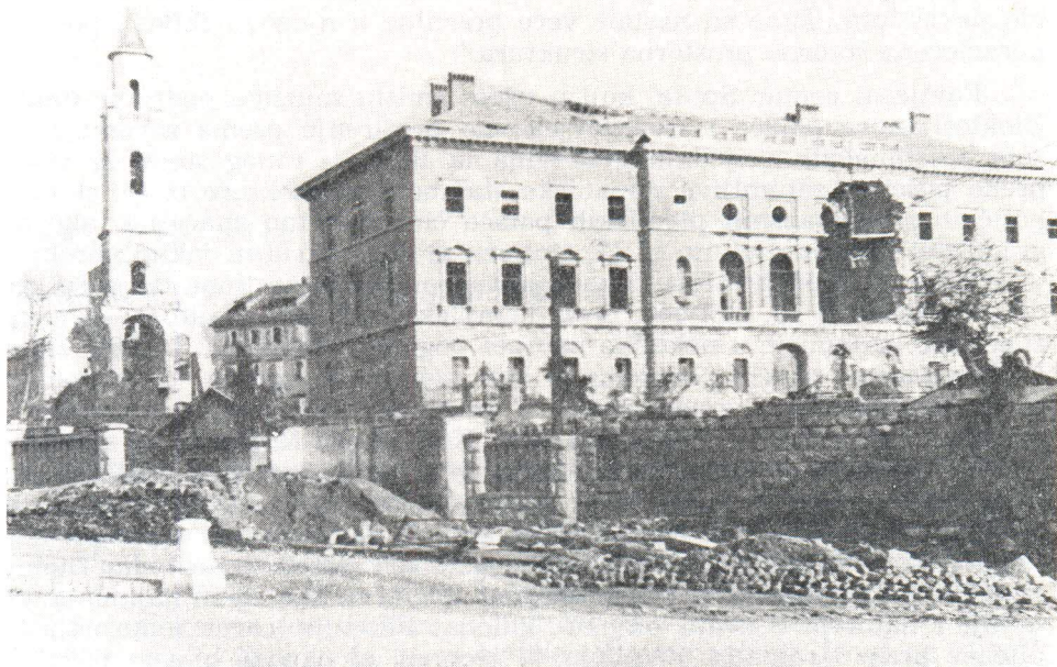
Porušena crkva sv. Petra i oštećena nadbiskupska palača na Lučcu

mostanom sv. Dominika važan je spomenik grada Splita iako je u posljednje vrijeme doživio znatne pregradnje. Izgrađen je u 17. stoljeću u baroknom slogu na istom mjestu gdje je bio raniji porušen zbog opasnosti od Turaka. 5) Bombama koje su padale svuda oko njega bio je doveden u veliku opasnost.