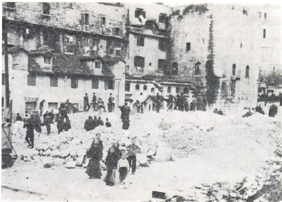
Raščišćavanje zatvora na obali