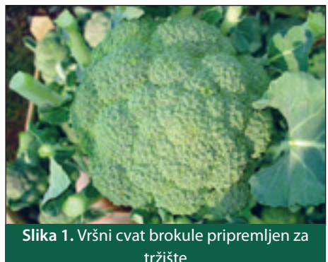
Slika 1. Vršni cvat brokule pripremljen za tržište

U uzgoju su primijenjene agrotehničke mjere gnojidbe (200 kg N, 80 kg P 2 O 5 i 215 kg K 2 O/ha), zaštite, međuredne kultivacije i navodnjavanja prema potrebi.