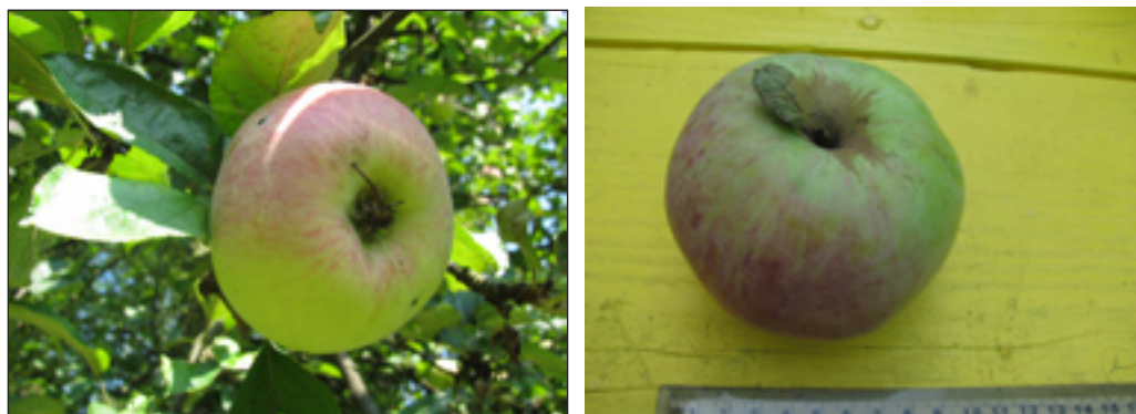
Slika 9. i 10.: Plod jabuke sorta Torulja ( peteljkino i čašično udubljenje)