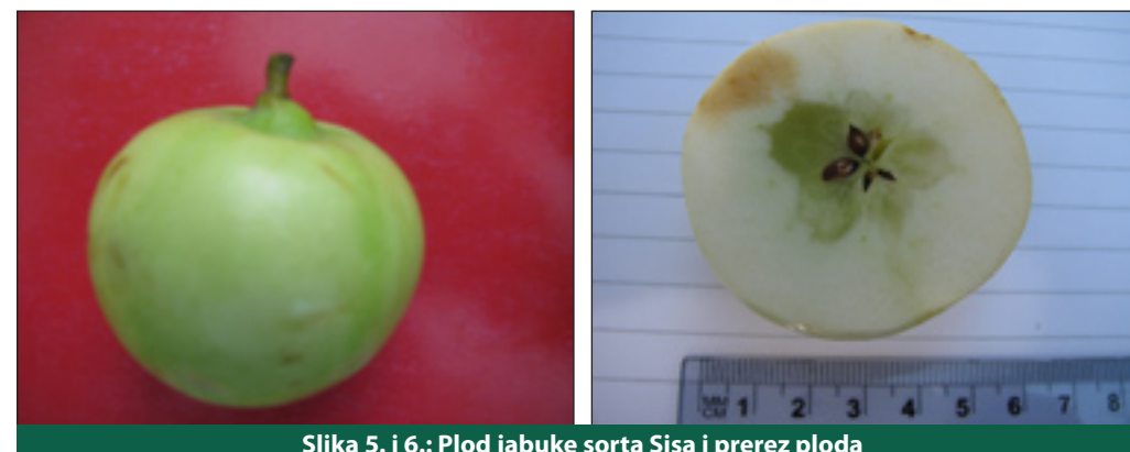
Slika 5. i 6.: Plod jabuke sorta Sisa i prerez ploda

Plodovi su joj srednje krupni do krupni, ovisno o rodnosti. Zarubljeno-stožastog su oblika, zelenkaste boje, glatke tanke kožice s voštanom prevlakom. U punoj zrelosti meso ploda postaje zrnasto i dobiva žuto-smeđu boju. Meso ploda je bijelo-žute boje, mekano, sočno, slatkastog okusa, ugodnog mirisa i arome. Lenticile su zelenkasto-bijele boje, raspoređene pretežno oko čaške i peteljke. Slabo se čuvaju u svježem stanju. Sorta ima karak-