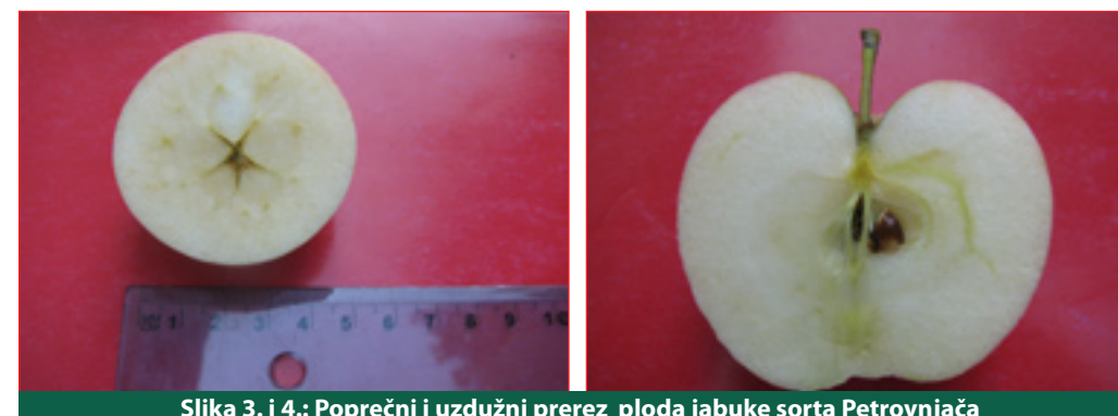
Slika 3. i 4.: Poprečni i uzdužni prerez ploda jabuke sorta Petrovnjača