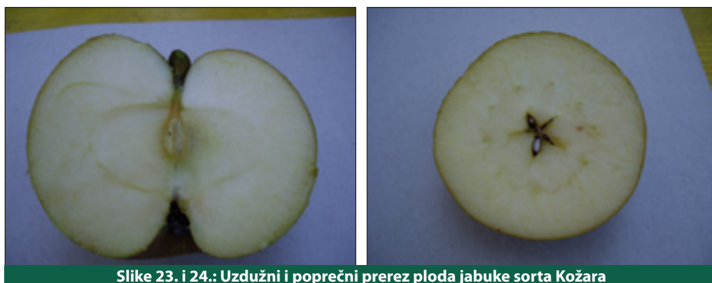
Slike 23. i 24.: Uzdužni i poprečni prerez ploda jabuke sorta Kožara

Plodovi su joj srednje krupni do krupni, umjereno sploštenog oblika. Imaju hrapavu pokožicu bez voštane prevlake. Osnovna boja ploda je žućkasta, ali plod je gotovo cijeli prekriven grubom hrđom tako da su plodovi više smeđi. U nekim je područjima nazivaju "krompiruša" zbog karakterističnog izgleda pokožice koji podsjeća na krumpir. Dopunska crvena boja nalazi se s osunčane strane ploda (Slike 21., 22., 23. i 24., tab. 6.).