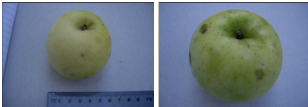
Slike 25. i 26.: Plod jabuke sorta Kraljica (čaično i peteljino udubljenje)

Cijenjena jesenska sorta, dozrijeva početkom listopada. Razvija vrlo bujna stabla s velikom, raskošnom piramidalnom krošnjom. Rađa redovito i obilno. Dosta je rijetko zastupljena na ovom području.