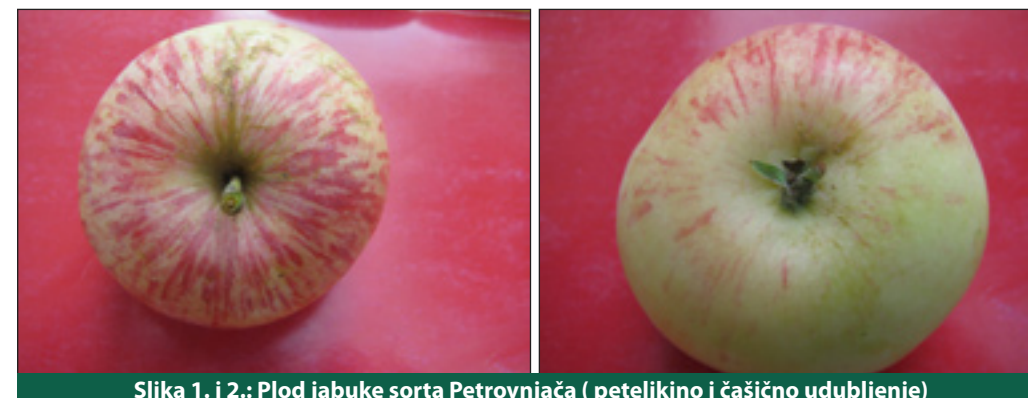
Slika 1. i 2.: Plod jabuke sorta Petrovnjača ( peteljkino i čašično udubljenje)

Petrovnjača ili Žetenica , kako je još nazivaju, vrlo je cijenjena rana sorta. Dozrijeva sredinom sedmog mjeseca, oko Petrova (29. lipnja), po čemu je i dobila ime. Uzgojena je na divljoj podlozi, a karakterizira je srednje bujan rast stabla s nepravilnom piramidalnom krošnjom. Rano cvate, rodi redovito i obilno.