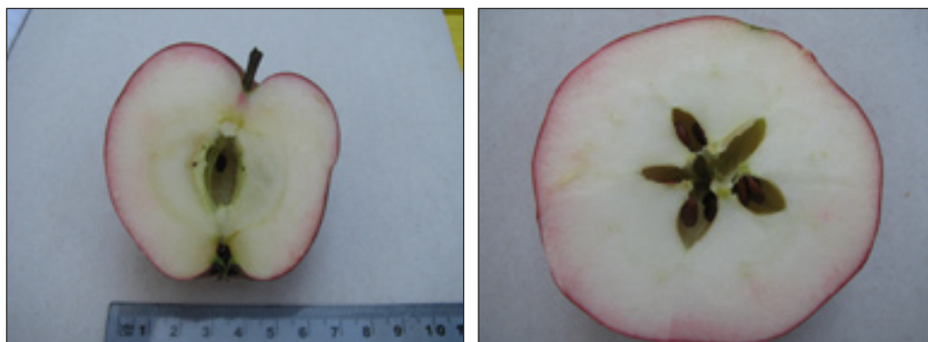
Slike 15. i 16.: Uzdužni i poprečni prerez ploda jabuke sorta Zvečarka

Plod je sitan do srednje krupan, umjereno sploštenog oblika. Kožica je tanka s voštanim prevlakom, crvene do tamnocrvene boje. Lenticele su dosta sitne, okruglaste, bijele, nepravilno i rijetko raspoređene. Meso ploda je bijelo, a uz samu pokožicu ružičasto, tako da na prerezu ploda izgleda kao da se boja s kože slila po mesu ploda. U punoj zrelosti sjemenke se odvajaju od sjemenjače tako da pri protresanju ploda zveckaju, po čemu je sorta i dobila ime. Meso ploda je vrlo sočno, slatkasto-kiselkastog okusa, ugodne arome.