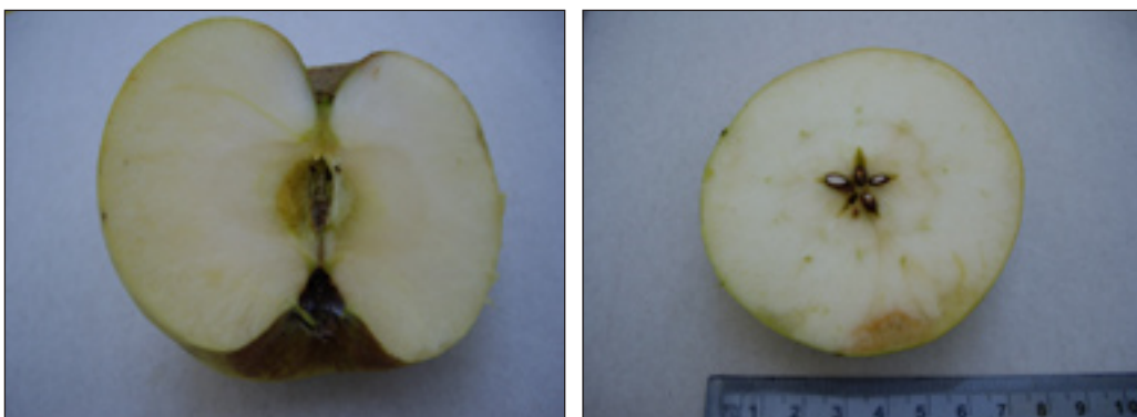
Slike 19. i 20.: Uzdužni i poprečni prerez ploda jabuke sorta Kanjuška

Plod je srednje krupan, sploštenog oblika. Boja ploda je žućkasta, s dopunskom crvenom bojom koja se samo blago nazire na osunčanoj strani ploda. Ima voštanu prevlaku. Meso ploda je bijelo, srednje sočnosti, čvrsto, slatkastog okusa i izražene ugodne arome (Slike 17., 18., 19. i 20., tab. 5.).