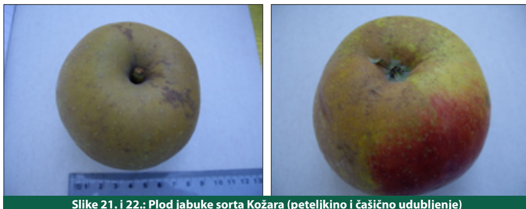
Slike 21. i 22.: Plod jabuke sorta Kožara (peteljkinio i čašično udubljenje)

Zimska sorta, dozrijeva početkom listopada, ali je užitna tek nakon što neko vrijeme odstoji te plodovi "nadođu". Razvija srednje bujna stabla s nepravilnom piramidalnom krošnjom. Uglavnom dobro i redovito rodi.