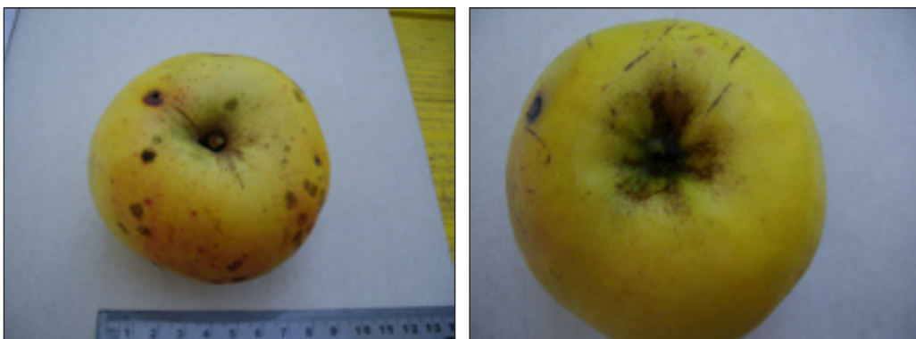
Slike 17. i 18.: Plod jabuke sorta Kanjuška (peteljkino i čašično udubljenje)

To je jesenska sorta, dozrijeva sredinom rujna. Poseban okus ima nakon što odstoji neko vrijeme u skladištu. Vrlo je cijenjena i omiljena kod stanovništva zbog svoje izrazito dobre mogućnosti čuvanja tako da se svježi plodovi mogu imati do travnja, pa i svibnja. Ima vrlo intenzivan miris koji omamljuje te nije preporučljivo boraviti u prostoru u kojem se drže veće količine jabuka. Po broju stabala, jedna je od zastupljenijih sorti na ovom području. Razvija bujna do srednje bujna stabla, nepravilne piramidalne krošnje.