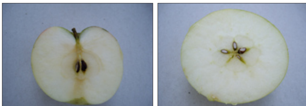
Slike 27. i 28.: Uzdužni i poprečni prerez ploda jabuke sorta Kraljica

Plodovi su joj sitni do srednje krupni, okruglasto sploštenog oblika. Pokožica je tanka, glatka, bez voštane prevlake. Osnovna boja ploda je žučkasta, s dopunskom crvenom bojom. Lenticele su sitne, okruglaste, zelenkaste, nepravilno i rijetko raspoređene po plodu (Slike 25., 26., 27. i 28., tab. 7.). Meso ploda bijele je boje, dosta čvrsto, sočno, slatkasto-kiselkastog okusa i vrlo ugodne arome. Plodovi se mogu dosta dugo čuvati.