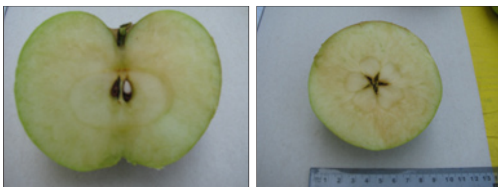
Slike 11. i 12.: Uzdužni i poprečni prerez ploda jabuke sorta Torulja