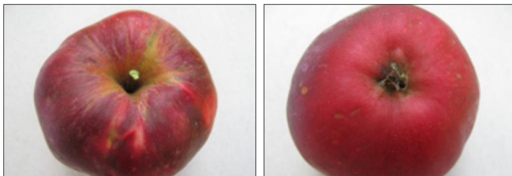
Slike 13. i 14.: Plod jabuke sorta Zvečarka (peteljkinio i čašično udubljenje)