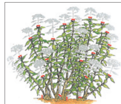
Slika 2. Hydrangea macrophylla