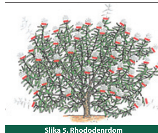
Slika 5. Rhododendron

Taj postupak se ne primjenjuje prečesto da se ne bi izazvao poremećaj u razvoju stabla. Treba izabrati najbolje smještene i najsnažnije izbojke.