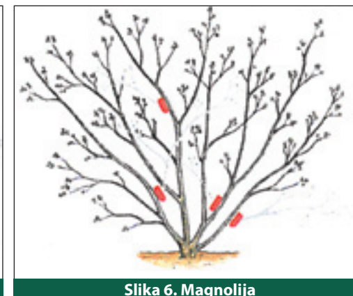
Slika 6. Magnolija