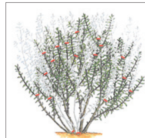
Slika 1. Forsythia

Vrstama koje cvatu u proljeće treba odrezati izbojke koji su ocvali iznad grananja te prikratiti do pola snažne grane u bazi koje nisu cvale. Tako će se potaknuti brojno grananje koje će nositi cvjetove sljedeće proljeće. Svakako treba ukloniti sve stare i suhe grane, a ostaviti sve izbojke koji su nastali početkom proljeća. Suručice koje cvatu ljeti treba ore-