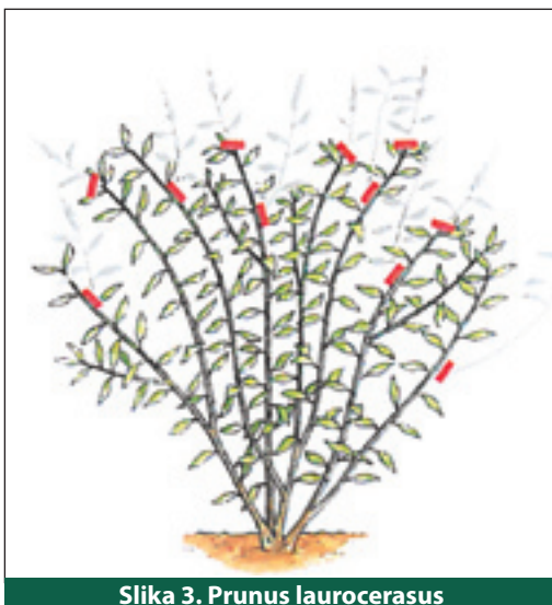
Slika 3. Prunus laurocerasus

Krajem travnja ili početkom svibnja, odnosno nakon cvatnje, odreže se nekoliko glavnih grana koje su previše razgranate, i to one koje su usmjerene prema sredini grma, te slabe i suhe grane. Svakako treba ostaviti izbojke koji su cvjetali jer će oni u jesen nositi ukrasne plodove.