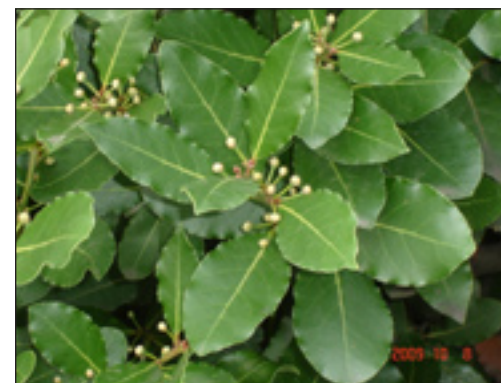
Slika 1: Lovor pred cvatnju (Dudaš, 2009.)