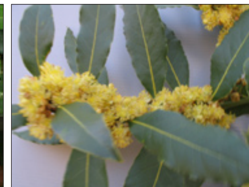
Slika 2: Muški cvjetovi lovora (Venier, 2007.)