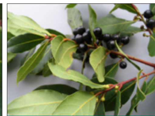
Slika 4: Plodovi lovora, (Venier, 2007.)