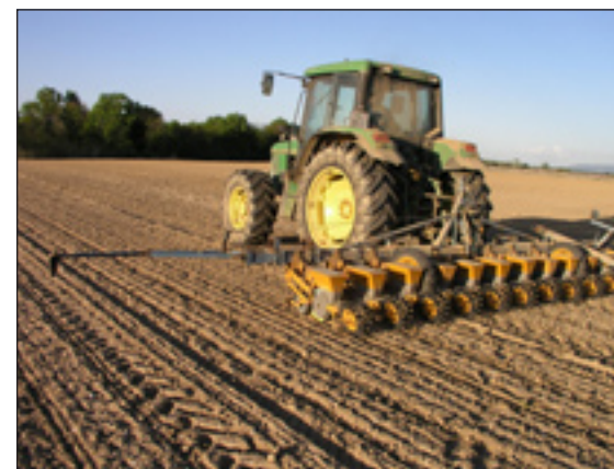
Sl. 2. Sjetva šećerne repe

U suvremenoj proizvodnji šećerne repe za postizanje potrebnog broja biljaka, odnosno visokog prinosa i tehnološke kvalitete korijena, odlučujući je razmak na koji se sjeme polaže u redu. Razmak u redu ovisi o kvaliteti predsjetvene pripreme tla, raspoloživoj ljudskoj radnoj snazi za eventualnu korekciju sklopa i okopavanje, roku sjetve i zaštiti od bolesti i štetnika. Na tlima s pravilno pripremljenim sjetvenim slojem i u optimalnom roku sjetve, šećerna repa se sije na konačan sklop tj. na razmak u redu od 17- 21 cm. Razmak u redu mora biti tako odabran da osigura 90.000-100.000 biljaka/ha u vađenju (za šećernati tip sorata). Kod sklopa manjeg od 60.000 biljaka po ha opada ne samo kvaliteta već i prinos repe. Šećerna repa se sije na međuredni razmak od 45 ili 50 cm. Bolje je koristiti međuredni razmak od 45 cm nego 50 cm jer se pri jednakom razmaku u redu dobije 10% više biljaka u vađenju po jedinici površine. Za sjetvu se upotrebljavaju pneumatske sijačice sa šest ili dvanaest sijačnih tijela (sl. 2.). Sjetva se mora pažljivo obaviti. Brzina sjetve ne smije biti veća od 5-6 km/sat. Prilikom sjetve treba višekratno kontrolirati razmak sjemenki u redu i dubinu sjetve.