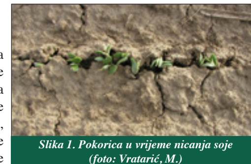
Slika 1. Pokorica u vrijeme nicanja soje

Pojava pokorice – Kada padne jaka kiša na pripremljeno tlo fine mrvičaste strukture, može se stvoriti pokorica koja usporava i onemogućava normalno nicanje biljaka soje (Slika 1.). Biljčice se iscrpljuju, tanke su, a hipokotil često puca. Pokoricu je moguće razbiti raznim drljačama kako bi se