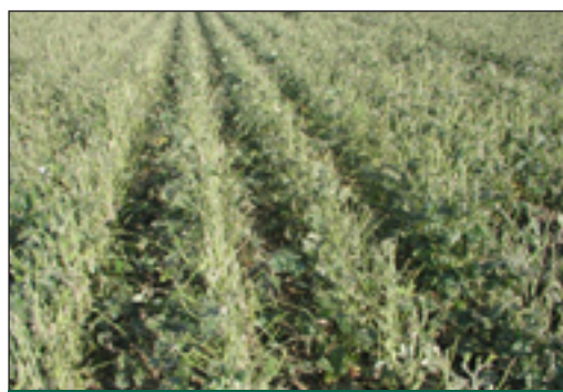
Slika 3. Ledotuča na usjevu soje

Oštećenja sojinih biljaka tučom tijekom vegetacije su gotovo redovita pojava u našim područjima uzgoja (Slika 3.). Dugogodišnjim praćenjem proizvodnje soje, u širokoj proizvodnji i na našim eksperimentalnim poljima, susretali smo se sa svim vrstama oštećenja od tuče. Jačina oštećenja od tuče značajno ovisi o brojnim činiteljima, kao što su: veličina i oblik ledene čestice, brzina padanja, gustoća i trajanje tuče, vrtloženje oluje i okolinski status biljke soje, te faze razvoja soje. Razlike u oštećenjima su i među sortama, ovisno o formi listova - jesu li širi ili uži. Te razlike su veće kod slabije tuče. Kako tuču uobičajeno prate jaki olujni vjetrovi, najveća oštećenja na biljkama soje su na dijelovima koji su okrenuti strani s koje dolazi ledotuča. Općenito, uroda zrna su smanjeni, u izravnom su odnosu s postotkom oštećenja i odbijanja listova, te brojem biljaka kojima je prebijena stabljika i odsječen vegetacijski vrh (Bačin, 1994.; Blažević, 1999.). Ustvari, soja je tijekom cijele vegetacije do zriobe, zbog svog nježnog lišća i zeljaste stabljike, osjetljiva na ledotuču. Ledotuča i u fazi zriobe može