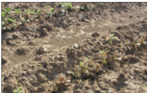
Slika 6. Oštećenja od herbicida – aktivna tvar: metribuzin

tiva, a to znači da se strogo treba držati uputa za primjenu pripravka tj. doza pripravka, voditi računa o fazi rasta u kojoj ga treba primijeniti, te ispravnog i uniformnog načina primjene. Sva naša zapažanja nalaze potvrdu u literaturi (Jordan i sur., 1987.; Harrison i Stroube, 1987.; McGlamery i Hager, 1999.; Buhler i Hartzler, 2004. i drugi).