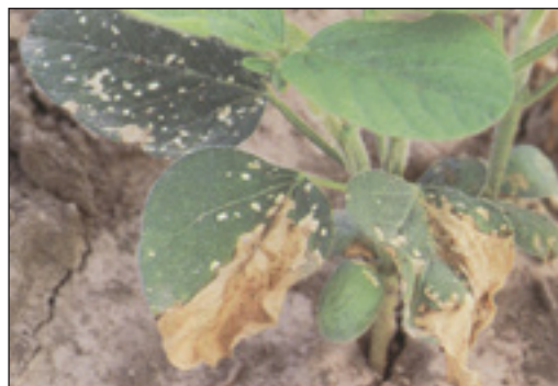
Slika 2. Oštećenje od mraza

Ovisno o klimatskim uvjetima, posebno prilikom ranije sjetve, na području uzgoja može doći do pojave mraza. U fazi kotiledona biljke soje su nešto otpornije nego u fazi V_1 i mraz može uzrokovati i propadanje mladih biljčica. Propadanje može biti mjestimično, s manjim brojem propalih biljčica, i u tom slučaju nije potrebno presijavanje. Na biljkama soje slabiji mrazovi uzrokuju samo manje nekroze listova i žutilo kotiledona do prvih pravih listova. Tada dolazi do odumiranja epidermalnih i nekih susjednih stanica lišća, posebice rubova kotiledona. Kasnije, kada se uvjeti za rast stabiliziraju, biljke s manjom nekrozom polako se oporavljaju i nastavljaju rast (Slika 2.). Međutim, kod jačih mrazova i duljeg razdoblja niskih temperatura ispod nule dolazi do jačih oštećenja i tkivo biljaka oštećenih mrazom poprima vodenasti izgled i mekanu konzistenciju. Takve biljčice, uglavnom, propadaju.