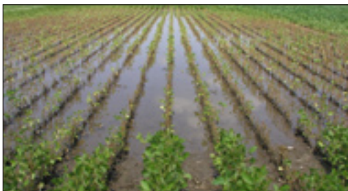
Slika 5. Usjev soje pod vodom u vegetaciji, 2006. godina

sustava prevladavaju anaerobni uvjeti i biljke soje ne mogu usvajati hranjive tvari, što se negativno odražava na razvoj biljaka soje u svim fazama razvoja, a konačna šteta znatno ovisi o dužini zadržavanja vode. Iz vlastitog iskustva i praćenja tih pojava tijekom više godina, možemo reći da potopljene biljke soje mogu bez posljedica pod vodom izdržati samo nekoliko dana, ako im vrhovi biljaka stoje iznad vode. Ako se