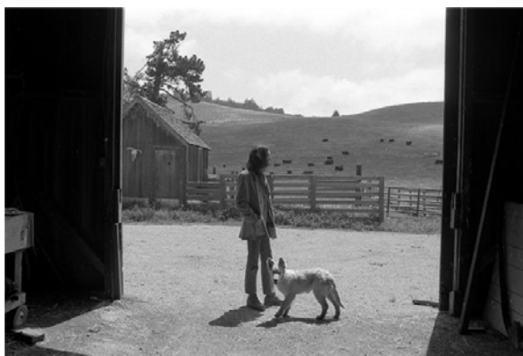
Slika 2. Neil Young

U glazbi, neke od pjesama koje spominju vampire su „Vampire Blues“ Neila Younga u kojoj je vampirizam metafora pohlepe u industriji nafte. Potom „We suck young blood“ Radioheada. Radi se o gothic pjesmi iz njihove diskografije u kojoj Thom Yorke portetira stare, moćne ljude kao vampire koji sišu život iz mladih i slabih. Smashing Pumpinks u svojoj „Bullet with butterfly wings“ pjevaju „The world is a vampire sent to drain“. Postavlja se pitanje zašto je svijet vampire nakon kojeg se nameće odgovor: Because it sucks. Slijedi moj omiljeni The Birthday Party koji u gothic punk maniri pjevaju u pjesmi „Release the bats“ o djevojci koju uzbuđuju vampiri i šišmiši ili je i sama vampir. Kultna oda klasičnim horror filmovima Vincenta Pricea je „Night of the Vampire“ Roky Ericksona u kojoj Drakula govori o svojim opsesijama ( http://www.rollingstone.com/music/pictures/the-15-greatest-songs-about-vampires-20110624 ).