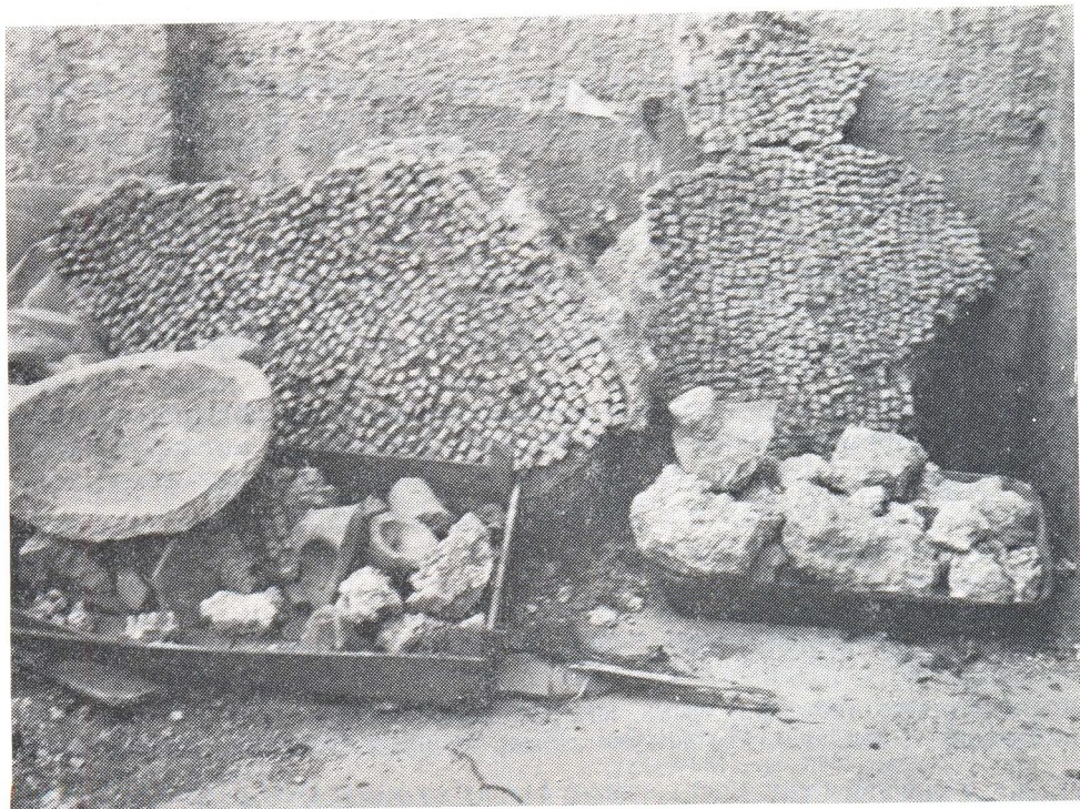
Srinjine, ostaci mozaika i ostali antički fragmenti u dvorištu kuće Zdravka Lisice

Po tehnici zidanja i grobnoj arhitekturi ove bismo grobnice mogli datirati u 17—18 stoljeće. Što se pak tiče rimske stele i ostalih rimskih arhitektonskih ulomaka, naknadno upotrebljenih u funkciji ovih grobnica, mogli bismo zaključiti da su doneseni iz obližnjih arheoloških lokaliteta, kojima ovo područje obiluje, što ćemo objasniti dalje u tekstu.