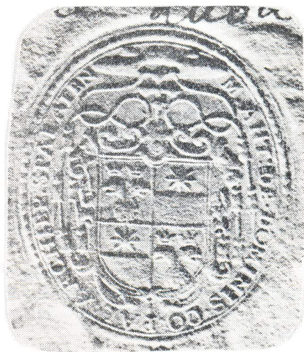
Snimak nadbiskupskog pečata Markantuna de Dominisa iz 1609.

U njemu taj prelat sebe naziva »Comes Palatinus Sacrae Theologiae Doctor Miseratione Diuina Archiepiscopus Spalatensis alias Salonitanus, Dalmatiae et totius Croatiae Primas etc«. Pismo je uputio Nikoli de Dominisu, rapskom i zadarskom plemiću, pitomcu »Collegii Germanici de Alma Vrbe« i zapečatio ga svojim pečatom. 23)