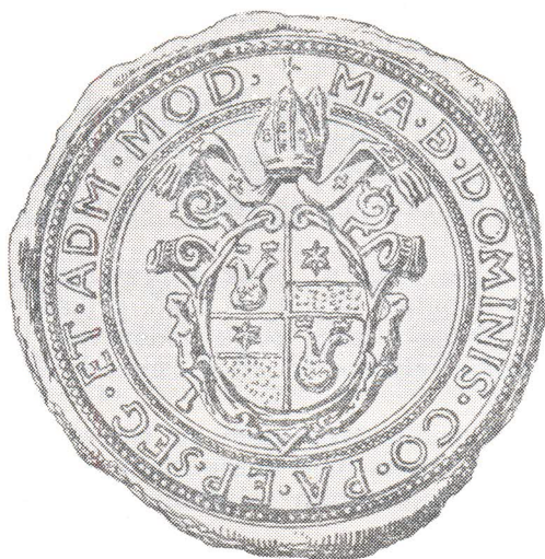
Crtež biskupskog pečata Markantuna de Dominisa (T. G. Jackson, 1887)