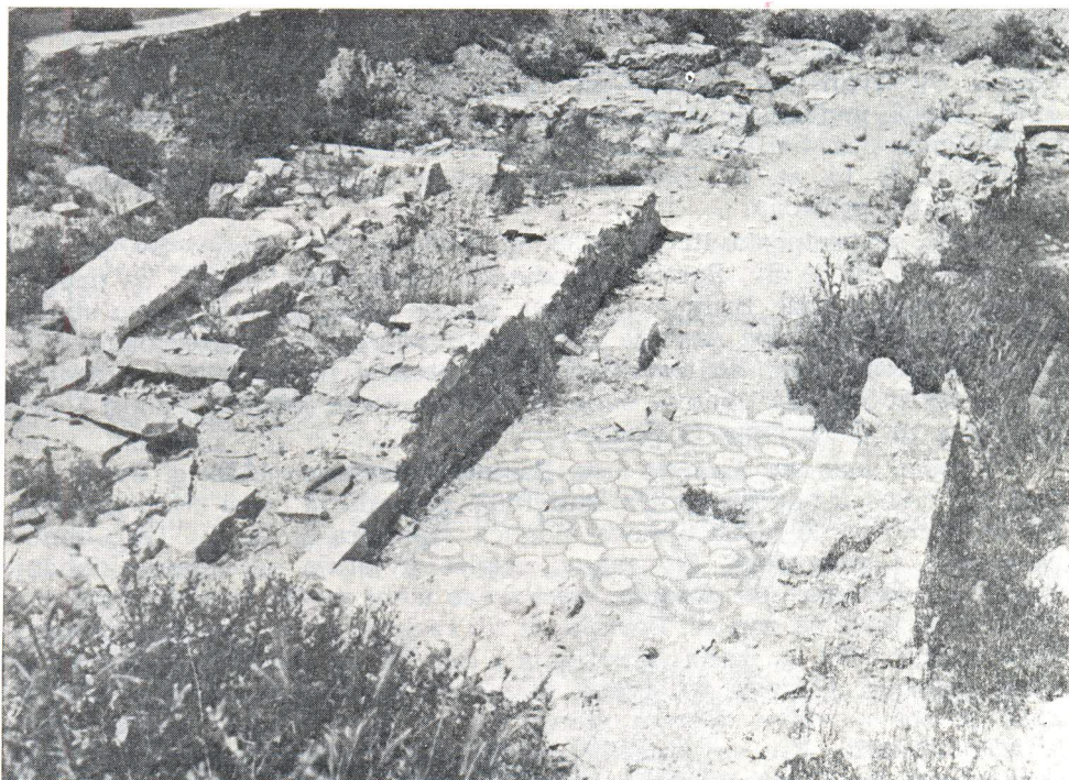
Dio crkvenog objekta s ranokršćanskim nazočnim grobom u ulici Žrtava fašizma. Stanje iz 1957.

Ako vijest iz Tomine »Kronike« prihvatimo kao točnu i vjerodostojnu, onda bi se sva tri prva dokumenta ove grupe odnosila na crkvu sv. Andrije van grada. Na istu crkvu se izgleda odnosi i 4. dokument u ovoj grupi. Kod dokumenta pod brojem 5. već su spomenute nemogućnosti točnog opredjeljenja. Zemlje, koje spominju dokumenti od 6. do 9. bi mogle biti sve uz crkvu izvan grada, no ne treba zaboraviti da i unutar grada sve do 19. st. 64) postoje vrtovi i obradive površine. Opredjeljenjem položaja izvan grada dolazimo do mjesta koje je blizu mjesta gdje se može očekivati i crkva sv. Kasijana. No, dokument koji spominje crkvu sv. Ivana Evanđelista »... de ecclesiis pictis ...« u ulici sv. Andrije i Kasijana 65) , govori da su se koncem 16. stoljeća te crkve razlikovale. Štoviše, u vizitaciji 1682. g. Cosmi 66) vidi ostatke crkve sv. Kasijana u ruševnom stanju, tako da bi se s dosta rezerve morao uzeti pokušaj