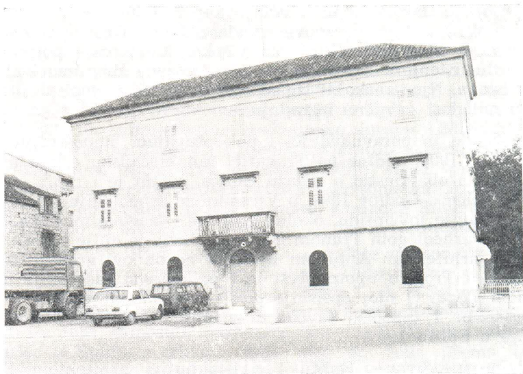
J. Slade, Morettijeva palača na Čiovu, Trogir

stručnjaka i radnika, a vjerojatno svi nisu ni spomenuti. Pri kraju Slade napisao »da su općenito svi radovi izvršeni pohvalno što se potvrđuje nakon što se ispitalo svaki pojedini rad... Cementni ukrasi svih vanjskih pročelja su izvedeni u dobroj građi i prema naređenju upravnika poslova«.