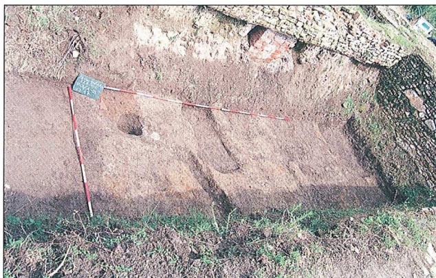
Sl. 5, 6 - Čepin-Ovčara, 2005.

Zaštitno iskopavanje na prapovijesnom višeslojnom nalazištu u Aljmašu-Podunavlje , vezano uz fazu 2. izgradnje Svetišta Gospe od utočišta uz novu crkvu, potrajalo je od 21. rujna do 30. studenoga. Raden je iskop na površini budućeg objekta 2 (istočno i sjeveroistočno od crkve) i kontrolni iskop uz objekt 1 (zapadno i sjeverozapadno od crkve), koji je već bio podignut bez prethodnih arheoloških istraživanja!