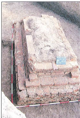
Sl. 7. Aljmaš-Podunavlje, 2005.

U iskopu objekta 2 otkriven je dio eneolitičkog naselja badenske kulture s nekoliko otpadnih jama i dvama zemuničnim objektima djetelinastog oblika, s vrlo velikom količinom uglavnom keramičkog materijala, litičkih i koštanih izrađevina, životinjskih kostiju itd. Najzanimljiviji nalaz bio je još jedan obredni ukop goveda u jami unutar badenskog naselja, drugi na istom lokalitetu.