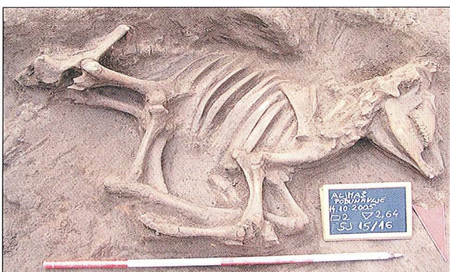
Sl. 8. Aljmaš-Podunavlje, 2005., Ukop goveda, foto: V. Radonić

Gornji sloj koji je pripadao srednjem brončanom dobu, potpuno je uništen i ispremiješšan s kasnijim horizontima, no ipak je prikupljena izvjesna količina bogato ukrašene keramike daljsko-bjelobrdske kulture.