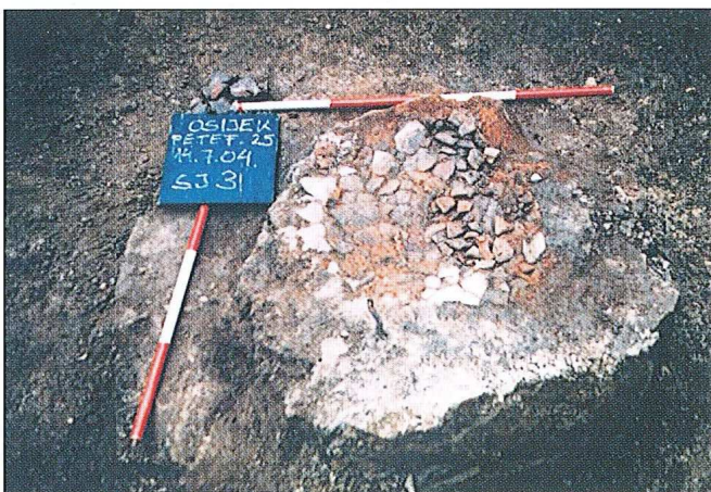
Sl. 3. Osijek-Retfala 2, Srednjovjekovno ognjište

Daleko značajnije je, međutim, istraživanje dijela prapovijesnih, eneolitičkih naselja badenske i kostolačke kulture, s nekoliko otpadnih jama vrlo bogatih nalazima i zemuničnim objektima. Kostolačka zemunica 14/15 bila