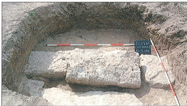
Sl. 2 - Čepin-Ovčara/Tursko groblje, 2004., Neolitska kuća