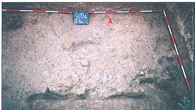
Sl. 1 - Čepin-Ovčara/Tursko groblje, 2004., Antički objekt

Osim manje sonde otvorene kako bi se ustanovilo o čemu se radi, radi nedostatka vremena i financijskih sredstava nije provedeno daljnje istraživanje objekta.