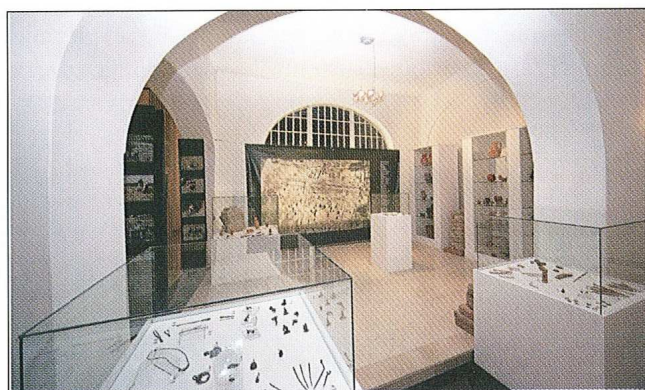
Sl. 4.1 izložba OS-V-PF