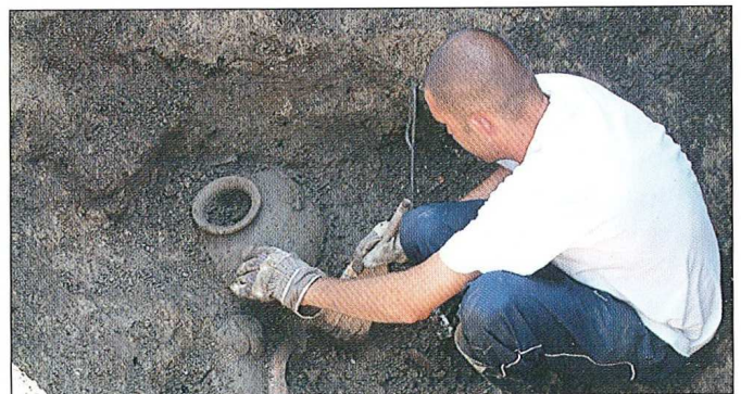
Sl. 2.1 OS-V-PF, foto; S.Filipović

voditeljice V. Katavić, prof. Pronađeni su ostaci urbane strukture zapadnog dijela antičke Murse sačuvani u vidu šest javnih zgrada s pratećom komunalnom i prometnom infrastrukturom. Unutar višeslojnih stratigrafskih odnosa pronadjeni su mnogobrojni i raznoliki arheološki pokretni nalazi od 1.- 4. Arheološki nalazi i dokumentacija pohranjeni su u Pododjelu antičke arheologije.