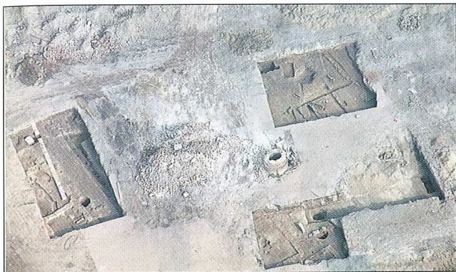
Sl. 3.1 Osijek – Silos aero snimak