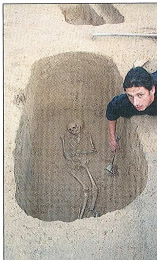
Sl. 1.2 grob 126