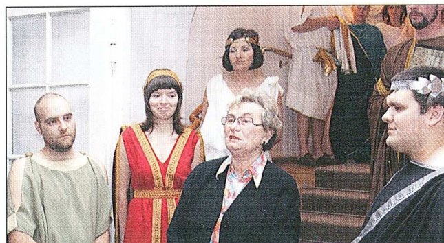
Sl. 4.2 OS-V-PF- otvorenje izložbe