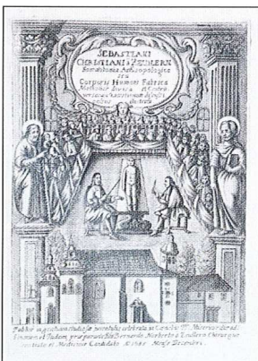
sl. 2 - Sebastiani Christiani a Zedlern. Somatotomia andropologica...Pragae, 1686.