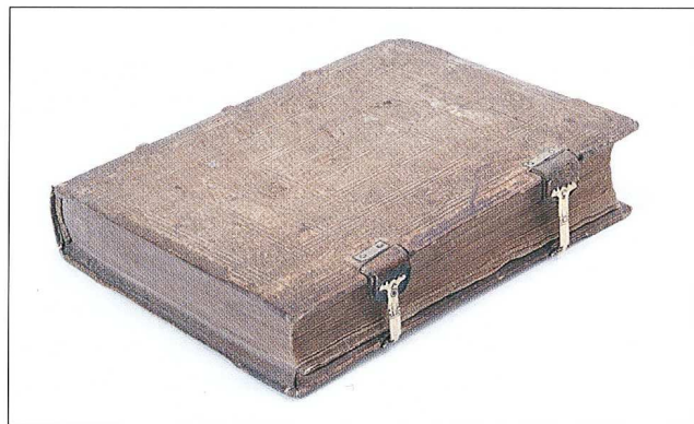
sl. 3a, 3b - Johann Pachhesium, Historien...Nürnberg, 1580. virum...Venetiis, 1576