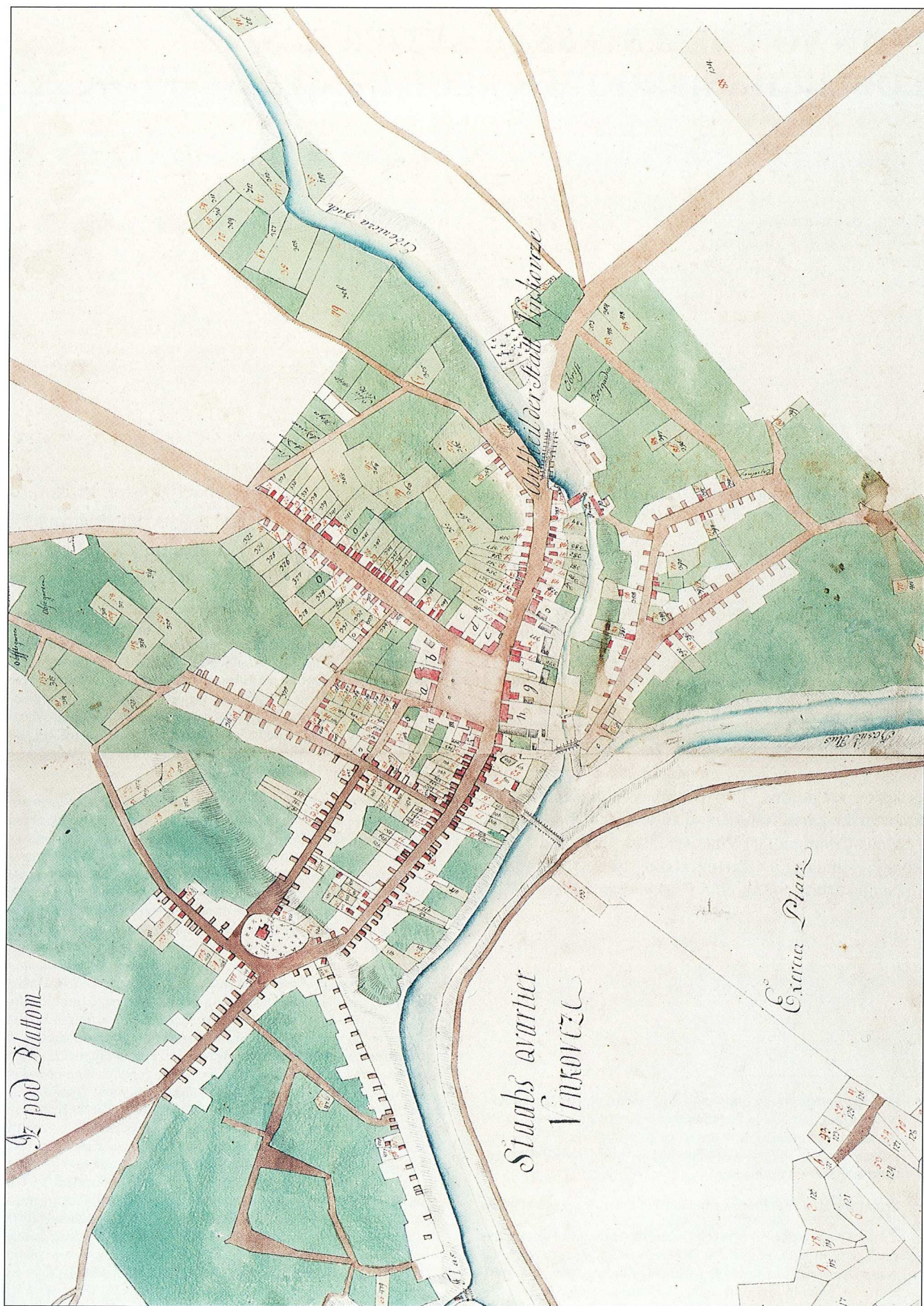
Sl. 1. Katastarski plan Vinkovaca iz 18. st.