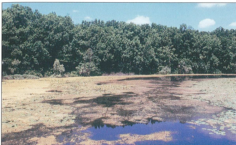
Sl. 5. otočki virovi, Šumarija otok, g.j. Slavir, Šumski predjel Lože.

Naziv objekta: Virovi Površina: 185 ha Datum zaštite: 18. 6. 1999.