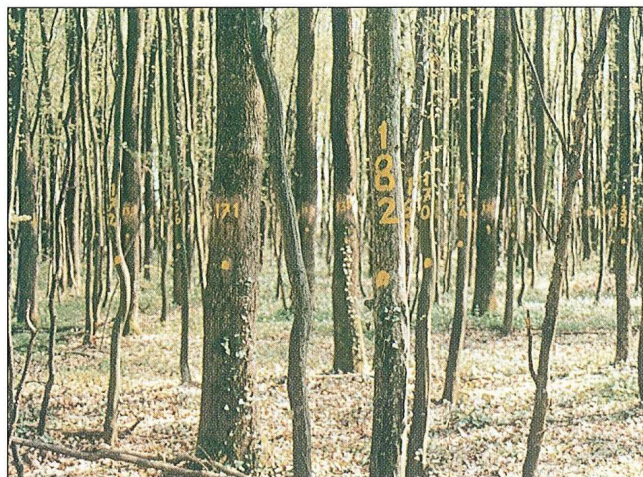
Sl. 4. Vrbanja - Radiševo, pok. ploha

Kategorija zaštite: posebni rezervat šumske vegetacije Naziv objekta: Radiševo Površina: 4.10 ha Datum zaštite: 26. 9. 1975.