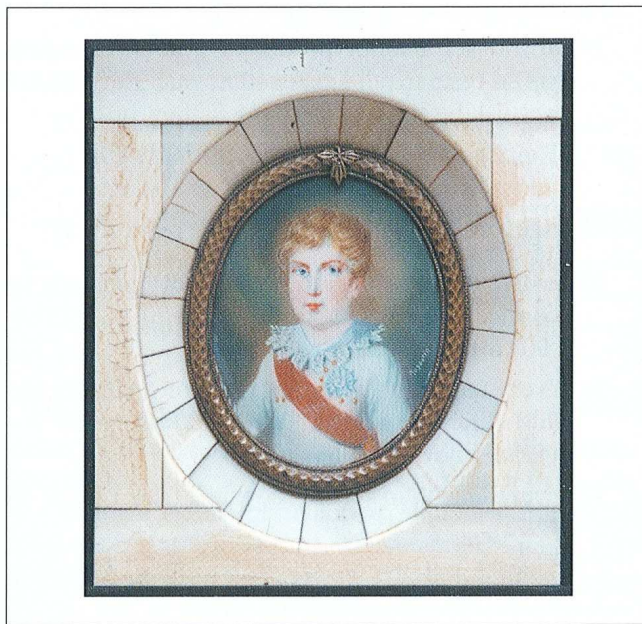
Sl. 5 a, b Osam minijatura na bjelokosti, koje prikazuju Napoleona i njegovu obitelj, a izradili su ih poznati francuski minijaturisti (Augustin) i dr., odnosno njihove radionice