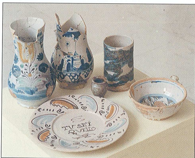
Sl. 10 Nalazi fajanse, kraj 17. st. - prva polovica 18. st., Osijek, Tvrdna-proširenje Izložbene dvorane "Waldinger" (arheološka iskopavanja 2003./2004. g.)

Proširenjem ovog izložbenog prostora na dvije susjedne prostorije otkriveni su ostaci srednjovjekovne (?), turske i barokne arhitekture, odnosno ostaci najranije faze izgradnje Franjevačkog samostana (kraj 17., početak 18. st.). Posebice su značajni brojni pojedinačni nalazi luksuznog stakla (gravirane čaše na nozi), fajanse i tzv. habanske keramike. Najveći dio ovih nalaza potječe iz velikog eliptičnog bunara i stare zidane