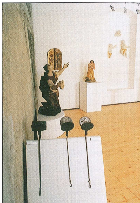
Sl. 13 Izložba "Sakralna umjetnost iz zbirki Muzeja Slavonije Osijek"

Uz izložbu je tiskan kvalitetan katalog u boji (130 str., 306 kataloških jedinica).