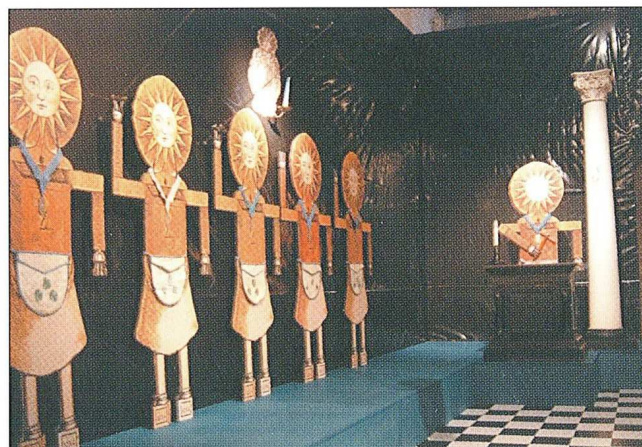
Sl. 14 Izložba "Osječka slobodnozidarska loža "Budnost""

Ova intrigantna tema izabrana je iz više razloga, prije svega radi velikog broja predmeta sačuvanih u fundusu Muzeja Slavonije, koji ujedno čine najveću ovakvu zbirku