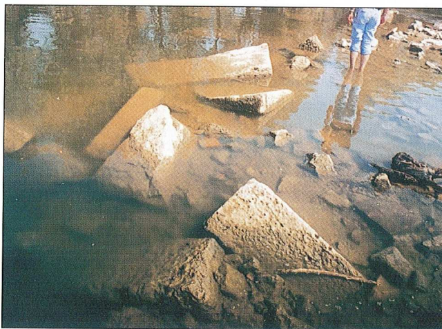
Sl. 11 Ostaci rimskog mosta na Dravi

Po prvi puta je izvršeno geodetsko snimanje suvremenim metodama, a uzeti su i uzorci drvenog šipa, čija je analiza metodom C 14 već dala izuzetno zanimljive podatke.