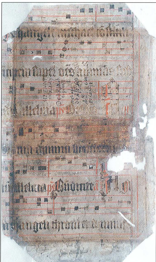
Sl. 9 Notirani fragment brevijara, 15./16. st.