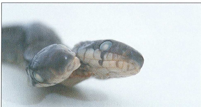
Sl. 1. Dvoglava zmija bjelica Elaphe longissima .