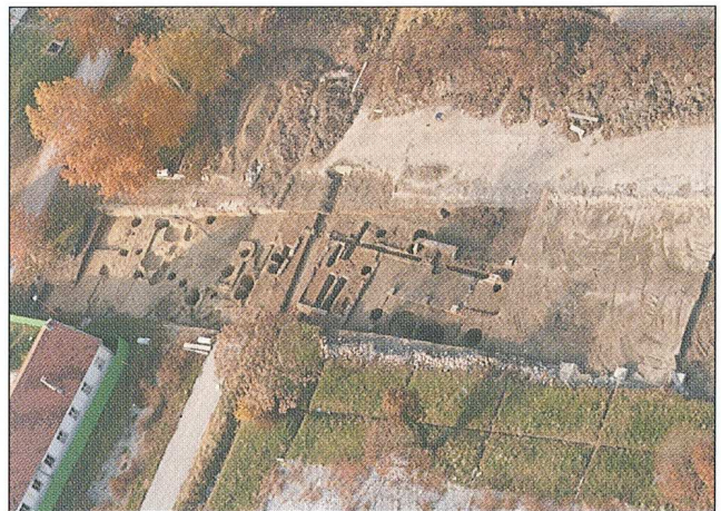
Sl. 3. 1. aerosnimak terena.

Materijal se nalazi dokumentiran u Popisu nalaza od br. 1 do br. 863, Popisu posebnih nalaza od br. 1 do br. 460, Popisu uzoraka od br. 1 do br. 129, Tehnička dokumentacija se nalazi u Popisu crteža od br. 1 do 242. Teren je snimljen totalnom stanicom i aerofotografiran.