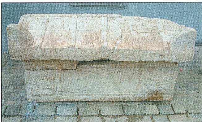
Sl. 4. Sarkofag.