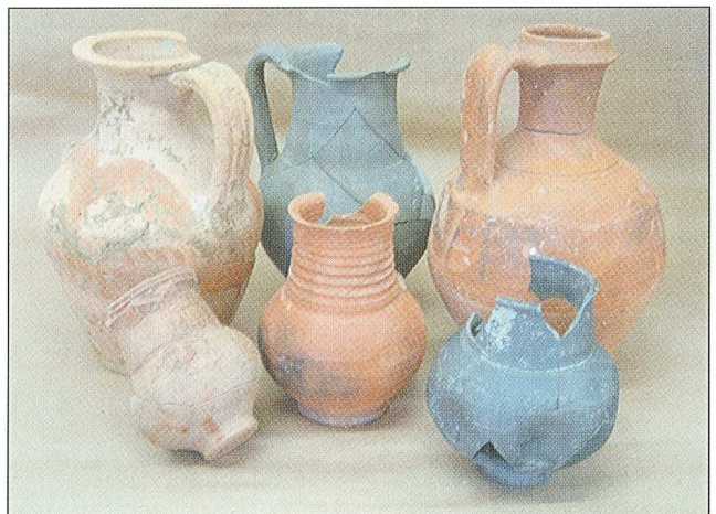
Sl. 3.2. posude, keramika, 2.-3. st.