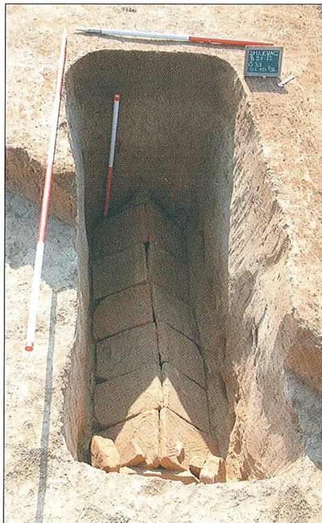
Sl. 1.a - G88.

Voditeljica arheološkog istraživanja je Slavica Filipović, viša kustosica i voditeljica Pododjela antičke arheologije Muzeja Slavonije.