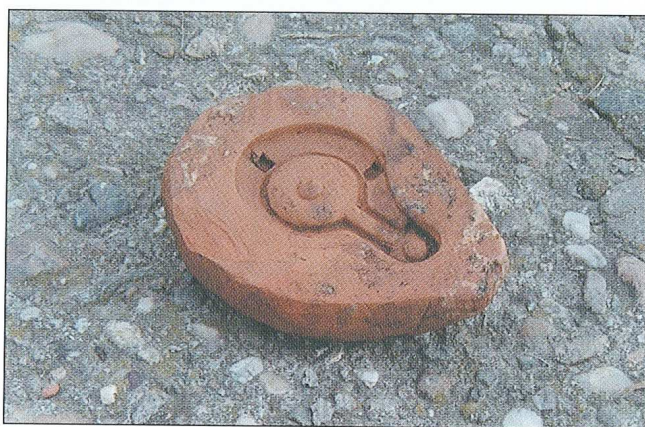
Sl. 2.2 Kalup lampice.

ZAŠTITNO ARHEOLOŠKO ISTRAŽIVANJE - OSIJEK, EVANĐEOSKI TEOLOŠKI FAKULTET-BIBLIOTEKA; CVJETKOVA/KRSTOVA na k.č.br. 7616/2, 7617, 7619 i 7620, trajalo od 10. 07. do 01. 08. 2003. g. Lokacija se nalazi u sklopu registriranog i zaštićenog arheološkog lokaliteta u Osijeku, upisanog u Registar nepokretnih kulturnih dobara pod registarskim brojem 239.