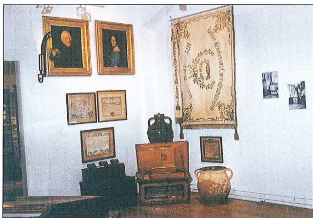
Sl. 3. Detalj izložbe 125 godina Muzeja Slavonije , Osijek.

Dio građe Odjela posuđen je i davan na uvid brojnim pojedincima i ustanovama, među kojima i Hrvatskom narodnom kazalištu u Osijeku, Arhitektonskom fakultetu Sveučilišta u Zagrebu, Hrvatskom restauratorskom zavodu, Hrvatskom institutu za povijest, podružnica u Slavanskom Brodu, Zavodu za znanstveni i umjetnički rad Hrvatske akademije znanosti i umjetnosti u Osijeku, Crvenom križu, Upravi za zaštitu kulturne baštine - Konzervatorskom odjelu Osijek, Zavičajnom muzeju Našice, Galeriji likovnih umjetnosti u Osijeku, Hrvatskom društvu likovnih umjetnika u Osijeku i drugima.