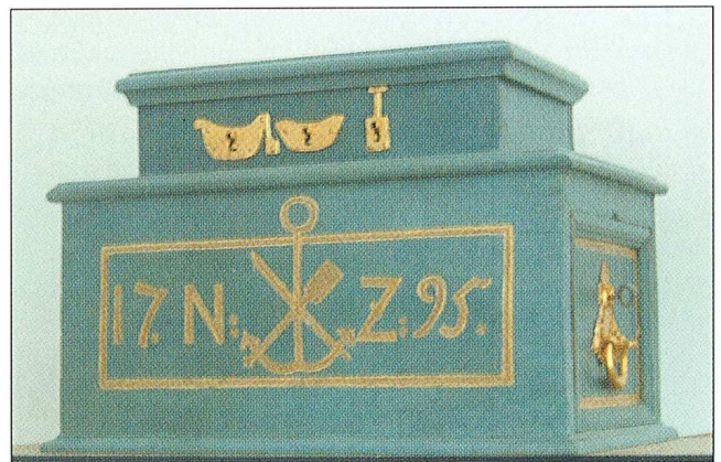
Sl. 1. Škrinja osječkog ladarskog ceha iz 1795. g.

restaurirani su sljedeći predmeti iz Zbirke zastava, Kartografske zbirke, Zbirke oružja i vojne opreme, Grafičke zbirke, Dokumentarne zbirke, Zbirke skulptura i natpisa i Zbirke kulturno-povijesnih predmeta: zastava osječkog ceha mesara, plan tvrđave Osijek iz 1786., pet pušaka karanfilki, skulptura sv. Duha sa spomenika sv. Trojstva, slika nepoznatog autora Faust za izložbu Ostavština osječke slobodnozidarske lože "Budnost", Atlas Vukovarskog vlastelinstva, knjiga veduta iz 1685. g., škrinja osječkog ladarskog ceha iz 1795. g.; skupina