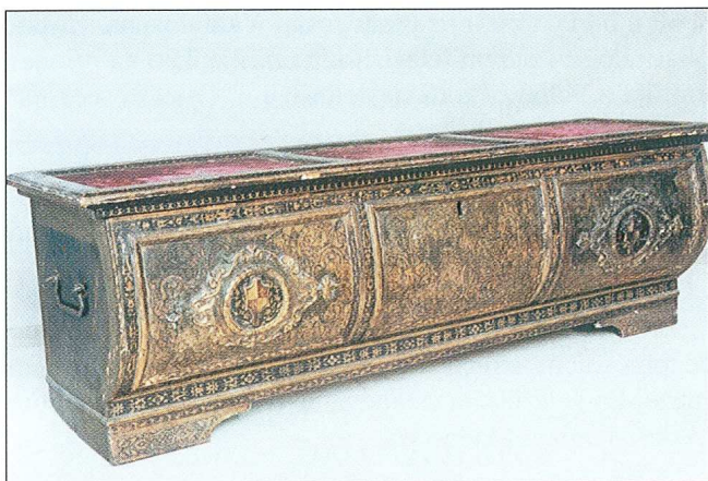
Sl. 3. Škrinja, Firenca, 17. st. (restaurirana 2003.)