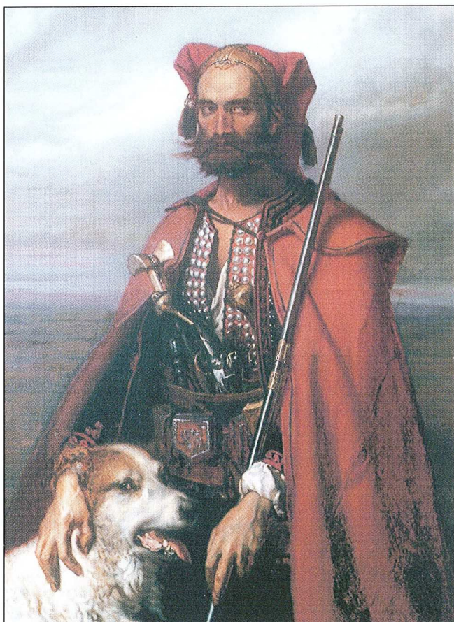
Sl. 5. "Slavonac sa psom", autorska kopija prema Louisu Galleu. (otkupljeno i restaurirano 2003.)