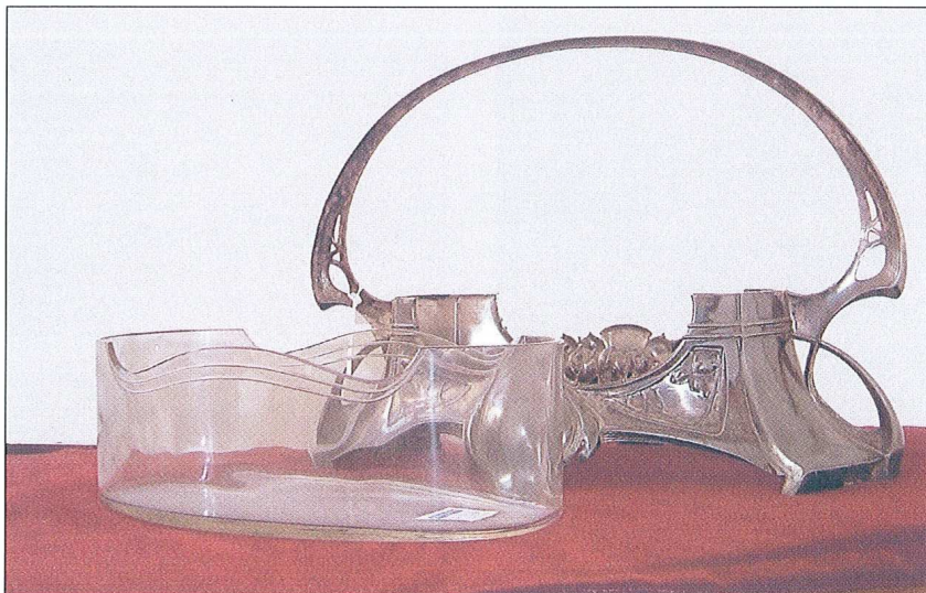
Sl. 2. Žardinjera, Njemačka, oko 1900. (otkup 2003.)