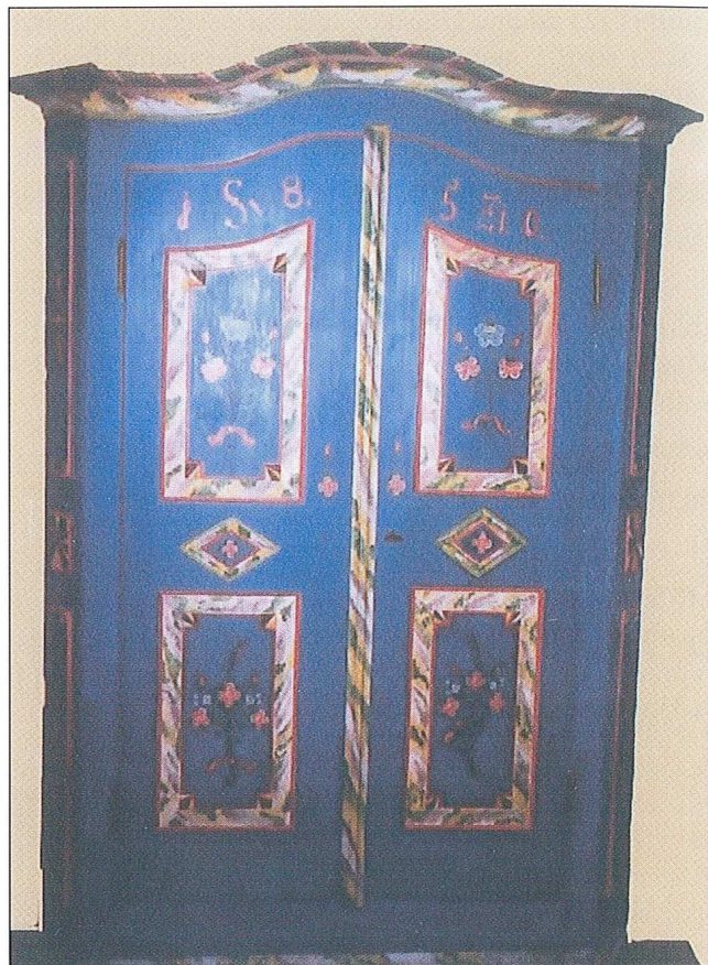
Sl. 4. Ormar, oslikani, Austrija, 1850. (restauriran 2002.)