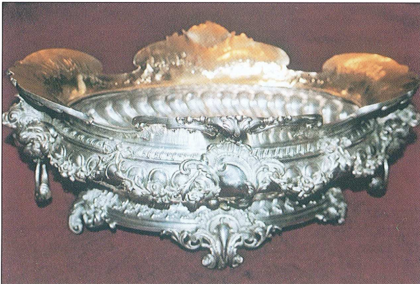
Sl. 1. Žardinjera, Njemačka, 1880-ih (otkup 2002.)