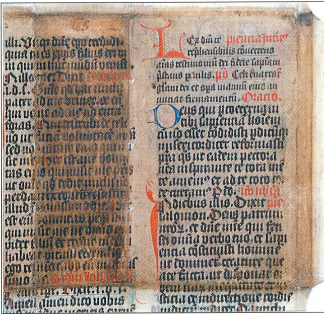
Sl. 1. Restaurirani fragmenti srednjovjekovnih rukopisa

tiskopisa predstavio se sa stotinjak primjeraka knjiga sakralne tematike, restauriranih srednjovjekovnih fragmenata rukopisa i notnih zapisa, molitvenika te bogatom zbirkom devotionalia.