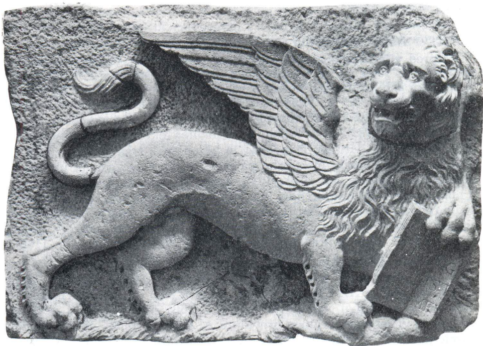
Reljef mletačkog lava u Muzeju grada Splita