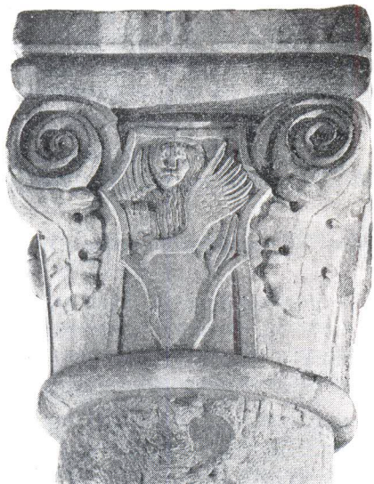
Mletački lav i Michielijev grb na kapitelu stupa u Arheološkom muzeju, foto: Ž. Bačić

nije poznato. U muzej su došli prije II. svjetskog rata, a vjerojatno su nosili lukove neke lože. Visina stupova s bazama i kapitelima iznosi 248 cm, obujam im je 105 cm, a visina kapitela 45 cm. Po njima su urezani mali križevi, a onaj s Michielijevim grbom ima nekoliko puta urezanu godinu 1901. Jedan je kapitel na tri strane ukrašen pupoljkom dok je na četvrtoj, u grbu tzv. oblika konjske glave, lav sv. Marka »in moleca« sa zatvorenim evanđeljem. Drugi kapitel također ima pupoljke, lava sa zatvorenim knjigom prikazanom djelomično u profilu, ali i grb obitelji Michieli 66) po čemu se oba stupa mogu datirati u vrijeme splitskog kneza N. Michielija 1472—1475. godine. 67)