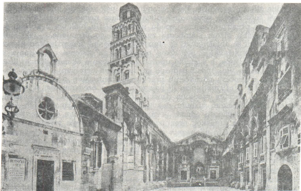
Peristil sa zvonikom stolnice prije obnove

primarno poništavanje carskih zdanja bijaše prepušteno uglavnom ranom srednjem vijeku koji ni za to nije imao dostatnih snaga a nije se ni isplatilo satirati sve ono što se moglo itekako rabiti i preuređivati. Povrh svega rani srednji vijek nije imao zreli neki novi način zamjenjivanja postojećeg odgovarajućim vrijednostima, nego je različitim preinakama, prema svojim prohtjevima i shvaćanjima, težio rastočiti ono što je bilo u građi i izvedbi njenu posve nadmoćno. Stoga razaranja i ne bijahu odlučna ni posvemašnja, a načelo prilagođavanja po sistemu urastanja ili uvlačenja sitnih članaka u monumentalnu oplatu nazire se u nizu još sagledivih slučajeva. Uz odsustvo njihove dostatne množine, međutim, daleko smo od mogućnosti viđenja i približne složenosti događaja. Zastalno se u nemoći podizanja i oblikovanja ičega značajno novoga nastojalo iskoristiti što više staroga, pa se dosta toga upotrebljivoga za stanovanje i privređivanje svjesno čuvalo kao materijalna podloga ili barem iskustveni izvor daljnjeg arhitektonsko prostornog stvaranja.