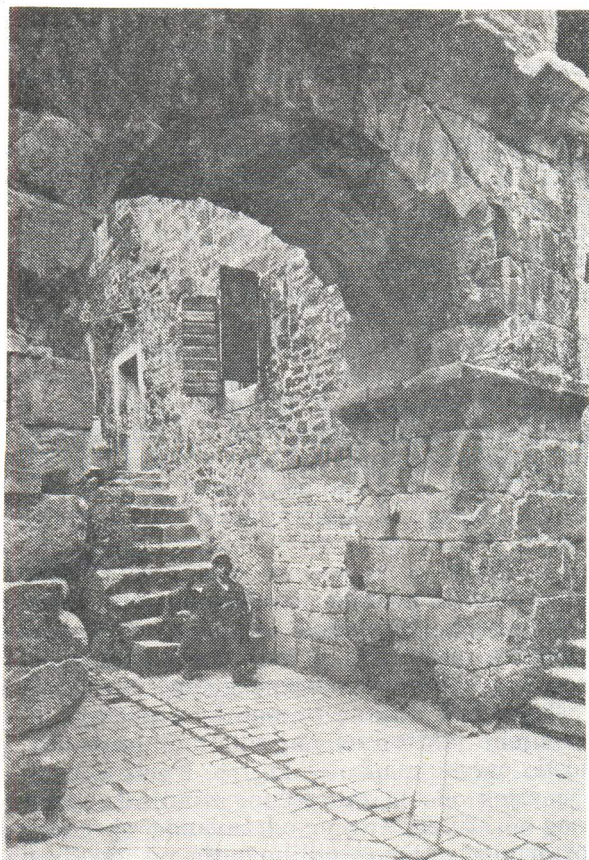
Detalj grada unutar Dioklecijanove palače

koji se ne odvaja u svojoj suštini od romaničkih načela i tehnika. A čitava bremenita njegova građevna struktura sačinjena je od mnoštva čistih čimbenika romaničkog stila, pa i izvorna u bogatstvu njihova stilski zakonitog slaganja do stupnja da je svako umovanje izvan tog konteksta uistinu izlišno. Ali u okviru procjene tog romaničkog izraza s plastičke više negoli konstruktivne strane, zamjetno je ne samo oponašanje nego i preuzimanje formalnih obrazaca iz antike. Pogotovo je to jasno u donjim katovima, po svemu sudeći završenima prije XIV. stoljeća i utoliko jače prožetim rečenim htijenjima. Na jednom izrazito srednjovjekovnom zadatku, nadahnutom vjerskim značenjima a ostvarenom modernim oblikovnim iskazima; dakle, zgušnjavaju se motivi rimskog porijekla i teme poganskog preteksta. Ne ulazeći pak u ikonološka tumačenja figuralnih prikaza u sastavu zvonika ni drugih pratećih uporaba njegova zdanja, dovoljno je uočiti semiotska značenja osebuje arhitekture da se vidi