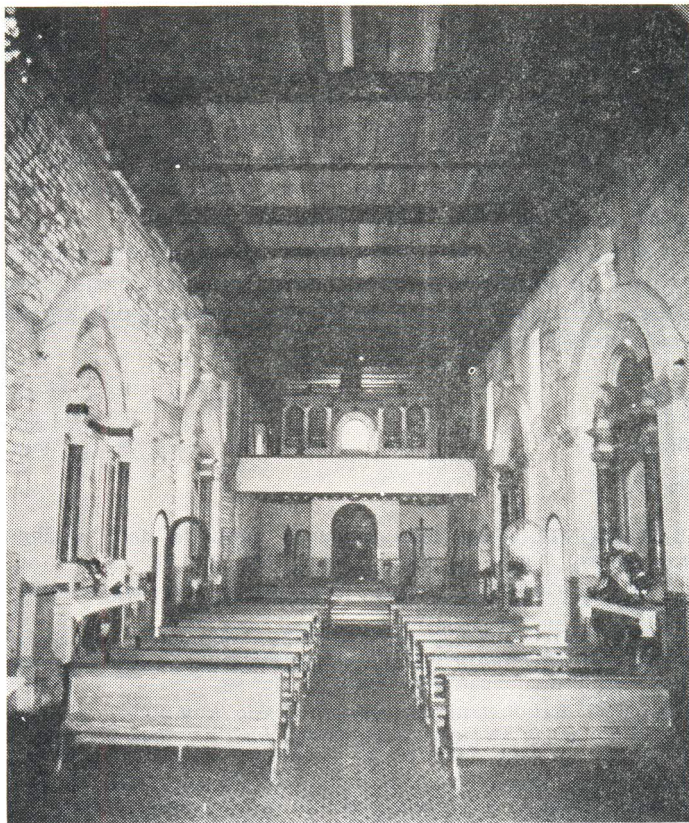
Obnova unutrašnjosti crkve sv. Frane

samostanskih prostora zaposjednut od stanara, a jedan dio nacionaliziran. Provedbeni urbanistički plan za povijesnu jezgru grada ipak je trebao voditi računa o cjelovitosti namjene prostora ovog samostana a ne samo prihvatiti status quo nekih davnih rješenja i izvlašćenja. A doista, knjižnica i arhiv ovog samostana zaslužuju punu pažnju, to više što je sve to nagomilano blago ostalo do danas skoro nedostupno i nepoznato široj kulturnoj javnosti i strukovnim oblastima. Kad bi se riješilo pitanje stanara, radovi na uređenju odgovarajućih prostorija mogli bi početi. Pri tome želimo dobiti i stručnu pomoć nadležnih ustanova za što bolje i suvremenije uređenje ovih sadržaja.