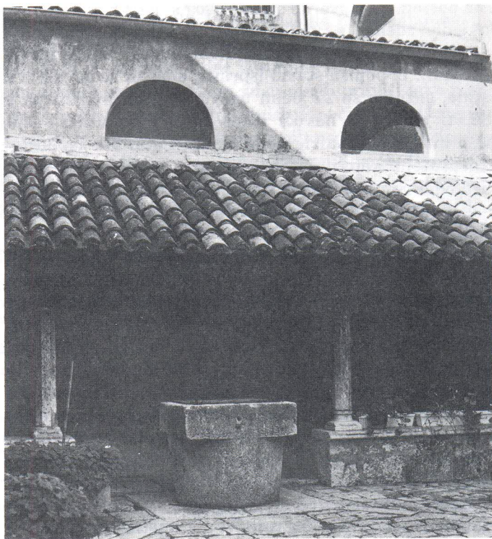
Klaustar samostana franjevacca na obali. Od dvije krune bunara sačuvana je samo ova jedna na zapadnoj strani.

luke na slikovitom i osamljenom položaju podignuta je u ranom srednjem vijeku benediktinska opatija. Sklop se sastojao od trobrodne bazilike i zgrada samostana s njene južne strane. Oko unutrašnjeg dvorišta s cisternom nizale su se stambene i gospodarske prostorije. Cisterna je nešto nepravilna oblika dimenzija približno 8x5 metara. Natkrivena je kamenim svodom na čijem se vrhu po sredini nalazi četvrtast otvor. Iznad je bila kruna koja se nije sačuvala. Velika zapremina cisterne pokazuje da je samostan morao biti prostran i da je u njemu živio veći broj redovnika. Sklop se tijekom vremena znatno izmijenio. Stara bazilika, a možda i dio samostana, porušeni su vjerojatno na prijelazu iz 17. u 18. stoljeće. Tako se na perspektivnom crtežu koji je 1706. godine napravio mjernik F. Danza vidi unutar prostora okruženog visokim obrambenim zidom jednobrodna crkva i zgrade. Prikazan je i vrt s lijevama, ali i čatrnja odakle je crpljena voda za zalijevanje povrća. 8)