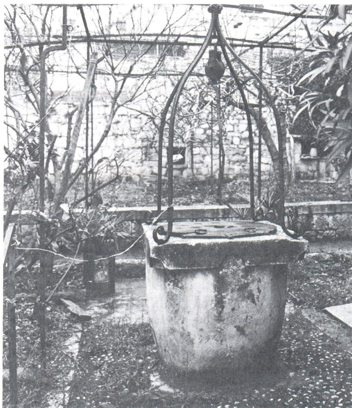
Vrt s bunarom Perišićevih dvora u pučkom predgrađu Veli Varoš na padinama Marjana.

služio za sakupljanje vode. Bio je ograđen niskim zidićem, a imao je pad prema trima otvorima u podu kroz koje se kišnica slijevala u spremište. Voda se zahvatala kroz dva otvora s cilindričnim kamenim kruništima. Cisterna više ne postoji, zatrpana je, ali su sačuvana kruništa iako pomaknuta sa svog