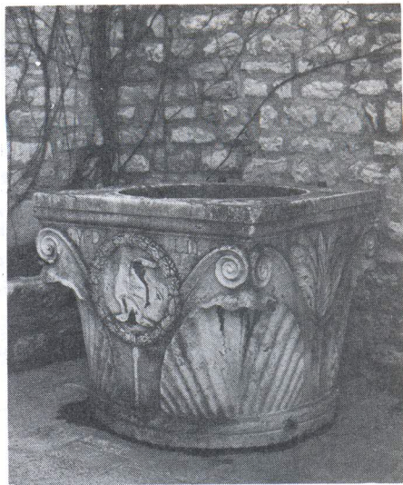
Kruna bunara danas u dvorištu srednjovjekovnog sklopa na poljani Iza Vestibula. Klasični dekor svojim rasporedom podsjeća na kapitel.

sred kojeg je također bio stari bunar. Godine 1919. palaču su kupili Cvitanić i Altaras i pristupili adaptaciji njenog prizemlja za trgovačke svrhe. Nažalost odmah su uklonili i krunu bunara. 5) Tako je postupnim pregradnjama potpuno narušen ugođaj koji je nekada taj prostor imao.