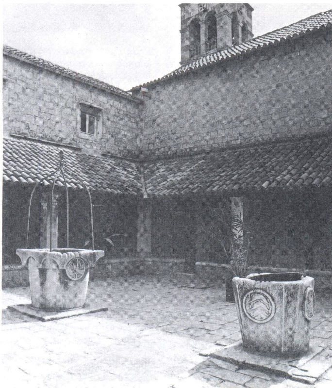
Klaustar samostana u Poljudu. Svečanom ugodaju doprinose dvije krune bunara likovno obrađene.

Samostanski kompleksi srednjeg vijeka gradili su se najčešće tako da su uz crkvu oko središnjeg dvorišta, klaustura, bile poređana stambene, gospodarske i ostale prostorije. Obično je u klausturu bila cisterna u koju se s okolnih krovova slijevala voda. U nacrtu mjernika Filipa Muljačića iz 1764, a i na starijim fotografijama vidi se da je otkriveni dio romaničkog klaustura samostana Sv. Frane na obali bio ograđenom stazom podijeljen na dva dijela. U svakom od njih se nalazila kruna zdenca izrađena od monolitnog kamenog bloka, ali bez ikakve dekoracije. Istočni je nestao u recentnim pregradnjama, dok je zapadni još uvijek očuvan. 7 Na poluotoku Sustipanu s istočne strane gradske