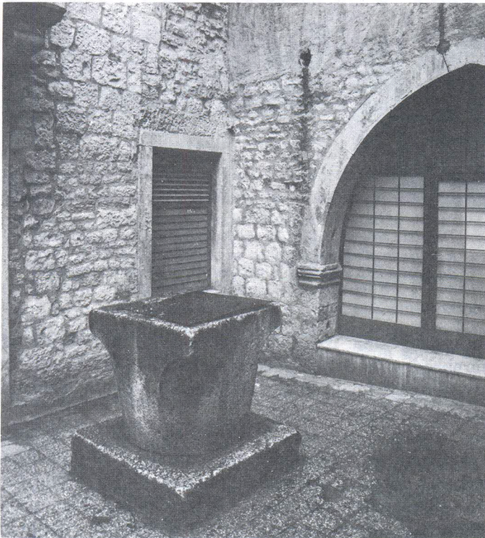
Ambijent dvorišta gotičke palače D' Augubio. Ranije su u njemu bila dva kruništa bunara, a sada je ostalo samo ovo jedno jednostavne izrade..

Drugi tip palače je s dvorištem u sredini sklopa. Karakteristično takvo rješenje je barokne kuće književnika De Carisa iz 17. stoljeća u Cosmijevoj ulici. U dvorištu je još uvijek sačuvana kruna bunara tipičnog košarastog oblika s kvadratičnom pločom na vrhu. Na njoj je reljefni De Carisov grb sa štitom razdijeljenim u dva vodoravna polja. Na gornjem su tri zvijezde i ljiljanov cvijet iznad tri brežuljka, a u donjem dvije ruke jedna iza druge. 4) Na isti način je građena klasicistička kuća kod Srebrenih vrata. Bunarska kruna jednostavne izrade je u sredini dvorišta. Reprezentativna barokna palača Cindro iz 18. stoljeća koja se nalazi u Krešimirovoj ulici ima prostrano unutrašnje dvorište