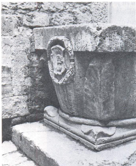
Kruna bunara u dvorištu kuće na poljani Grgura Ninskog. Pored renesansnog dekora opažaju se i listovi u donjim vrhovima omiljeni motiv baza stupova srednjeg vijeka.