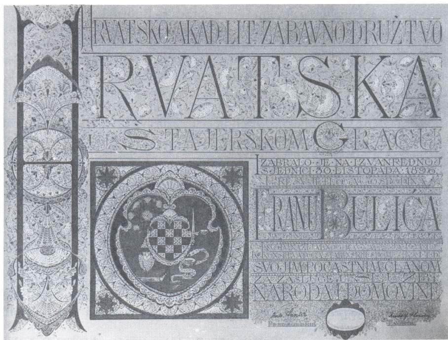
Diploma don Frane Bulića, foto: Ž. Bačić

Posilovićeva molba prosljeđena je predsjedništvu Sabora, no ono ju je odbilo i vratilo zajedno s adresom. 14) Ojađen time Posilović piše Buliću i moli ga da adresu pokaže svojim prijateljima ne bi li je otkupili i darovali novom predsjedništvu Sabora. Pri tome ističe da od 1876. radi u "hrvatskom narodnom stilu te evo u svojoj 70 godini je posljedica da radi toga svoga rada moram skapavati". 15) Bulićev odgovor na ovo pismo nije sačuvan, ali je mapa ostala u muzeju pa mu Posilović 9. I. 1920. ponovno piše i moli ga da predloži dalmatinskoj vladi otkup adrese za muzej i to korica i prvog lista. Druga bi se dva lista mogla upotrijebiti za novogodišnju čestitku grada Splita Thomasu Woodrowu Wilsonu. Posilović bi na njima ispisao naslov i čestitku te izradio korice, a pridružili bi im se arci s potpisima splitskih građana. Pri tom se žali da je u novoj državi imao samo jednu narudžbu i to diplomu Vatroslava Jagića prigodom izbora za počasnog građanina Varaždina. 16) Čini se da je i ova molba ostala bez uspjeha jer u svibnju 1920. Posilović šalje Buliću pismo za čehoslovačkog konzula u Splitu s molbom da mu ga uruči zajedno s adresom. Naime, Posilović