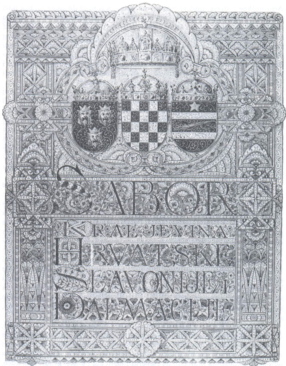
Saborska adresa 1917, foto: Ž. Bačić