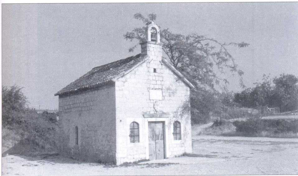
Crkvice sv. Duje u Dujmovači na snimku iz 1992. godine. Pred nekoliko godina njen je okoliš hortikulturno ureden, a izvedena su i dva kamenom popločana pristupna puta

L'articolo descrive anche la storia multisecolare (dal XVI al XVIII secolo) della nobile famiglia Bakić (Bachich) de Lak. Dal suo ramo spalatino proviene Pietro Bakich de Lac, vescovo bosniaco residente a Đakovo in Slavonia, il quale nel 1748, (un anno prima della sua morte), a sue spese restaurò e ingrandì la chiesetta di San Doimo a Dujmovača, distrutta dai Turchi Ottomani, la quale d'allora fino all'anno 1917 era nella proprietà dei successori di Bakić, cioè della famiglia spalatina Muljačić (Mugliacich).