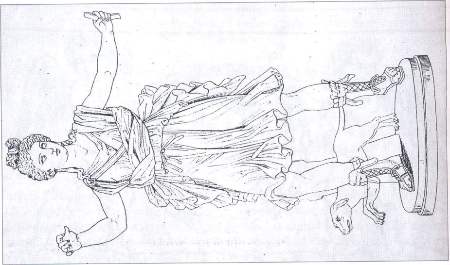
Dijana. Izvor: Visconti, 1818. T XXX.