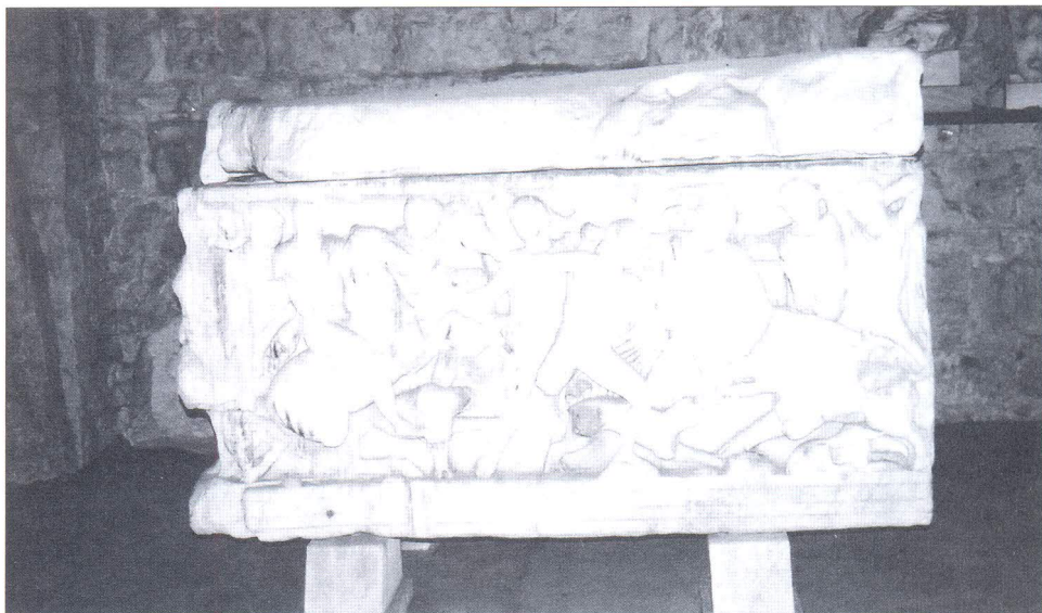
Sarkofag Meleagrova lova na kalidonskog vepra. (Arheološki muzej, Split)