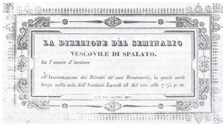
Pozivnica na otvaranje galerije portreta dobrotvora Biskupskog Sjemeništa u Splitu 28. lipnja 1847.