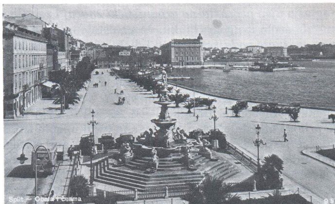
"Monumentalna česma", snimljena oko 1930. godine.

česma", uz ostalo kaže i ovo: "Bajamontijev poziv na sakupljanje za monumentalnu česmu naišlo je na živ odaziv u Splitu i 3.000 se Splićana tome odazvalo i dalo svoj prinos tako da je bilo sakupljeno 20.000 forinti." Međutim za tu tvrdnju, Novak ni u daljem tekstu, ni u bilješkama, ne navodi iskorišteni izvor podataka. 22)