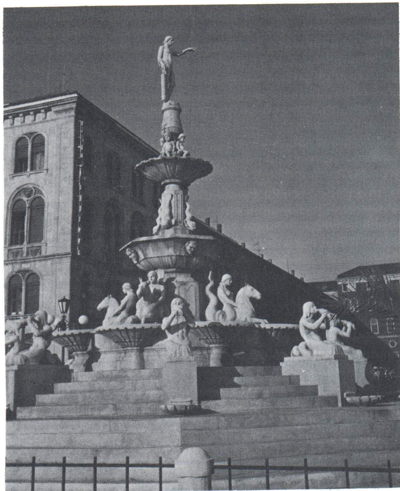
Poliesterska kopija "Monumentalne česme", izrađena za potrebe snimanja televizijske serije "Velo misto" 1979. godine.

"Monumentalna česma" je 30. maja 1947. srušena, raskomadana, razdrobljena i uništena, – u par parčadi. Genij, školjke, morske sirene, tritoni, kameni postamenti, blokovi kararskog kamena, vredni 50–70.000 dinara, – sve je pretvoreno u kamen za tucanik!