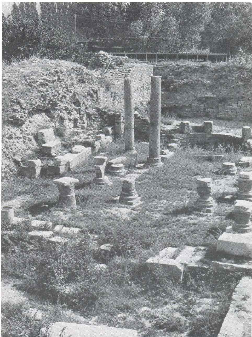
Starohrvatska crkva u solinskoj Gradini