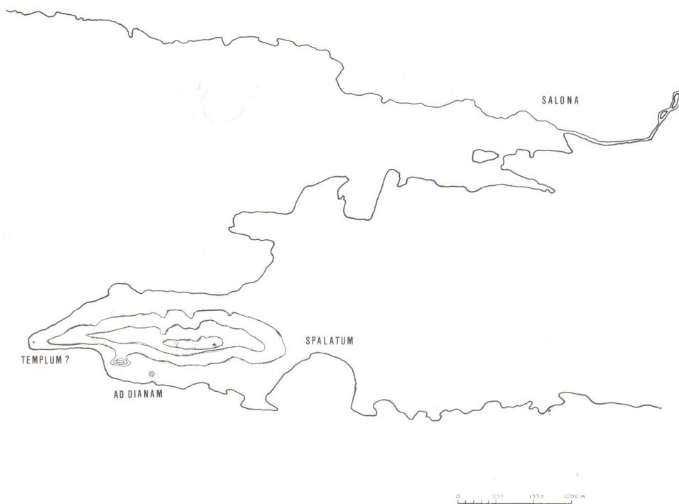
Karta splitskog poluotoka

drugi ulomak sarkofaga s natpisom. Pronađen je uzidan u kućici pored crkvice sv. Jurja. Tekst sadrži formulu D M pa se može datirati u pretkršćanski period. 15) I ovaj sarkofag treba promatrati zajedno s prethodnim, oni naime potvrđuju mogućnost da je ranokršćanski sakralni objekt na Mejama legao na nekakvu prijašnju pretkršćansku građevinu, kako se to veoma često dešava u našim krajevima.