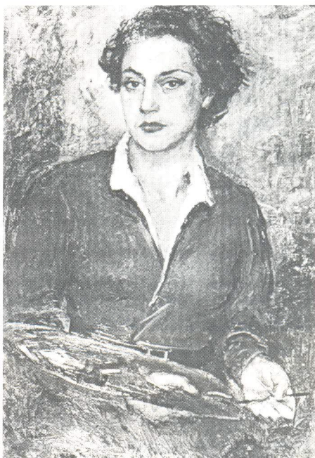
Autoportret s paletom, 1938 ulje, Trogir, Galerija Cate Dujšin-Ribar

Cata (Katica) Dujšin-Ribar rođena je 17. listopada 1897. u Trogiru od oca Vjekoslava Gattina i majke Justine rođ. Buble. Godine 1898. obitelj seli u Kotor, u kojemu će Cata proživjeti šesnaest godina, boraveći povremeno i u rodnome gradu. Sa svojima se 1914. vraća u Trogir, a 1915. dolazi u Split, gdje 1916. uči "risanje" na Graditeljskoj, zanatlijskoj i umjetničkoj školi, koju je vodio inž. K. Tončić, a slikarstvo predavao E. Vidović. Godine 1917. upisuje se u Zagrebu na Višu umjetničku školu (buduću Akademiju likovnih umjetnosti), gdje su joj uz ostale nastavnici bili M. Vanka, Lj. Babić, M. C. Crnčić, B. Csikos Sessia, J. Kljaković, F. Kovačević, a kolege I. Job (s kojim je imala "sentimentalnu vezu" kako se sjećao M. Krleža), N. Đorđević, A. Augustinčić i O. Postružnik. Studij je prekinula 1921. nakon što se 1920. udala za tada još mladoga Splićanina Dubravka Dujšina, jednog od najvećih hrvatskih glumaca, ali će 1924./25. nastaviti usavršavanje u