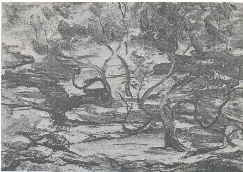
Cata Dujšin-Ribar, Crvena zemlja, 1949, ulje/Trogir, Galerija Cata Dujšin-Ribar

slikarstvu kod V. Becića. Prva je Catina samostalna izložba priredena 1927. u zagrebačkom atelijeru umjetnice na Marulićevu trgu 5 i u splitskom Galićevu salonu, a na nju se nadovezao veliki niz, u kojemu se po obujmu ističe retrospektiva 1977. u Umjetničkom paviljonu u Zagrebu u povodu pedesete obljetnice umjetničkoga rada. Uz brojne domaće poseban spomen zaslužuju