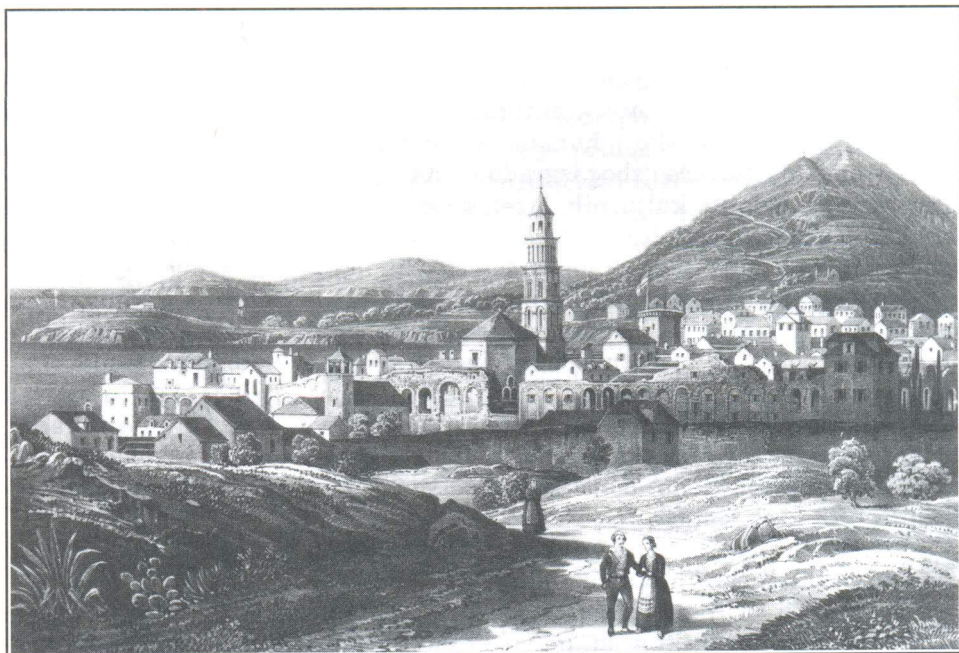
J. Högelmüller: Pogled na Split s istoka, oko godine 1850.

galomanskim težnjama ka količini i veličini. Doseljenici iz zaostalog zaleđa, koji su prije umjerenije stizali u grad i pridonosili mu svježim fizičkim i duhovnim snagama, tada su nadmoćno prevladali i dali u mnogim vidovima gotovo ruralni pečat urbanoj sredini.