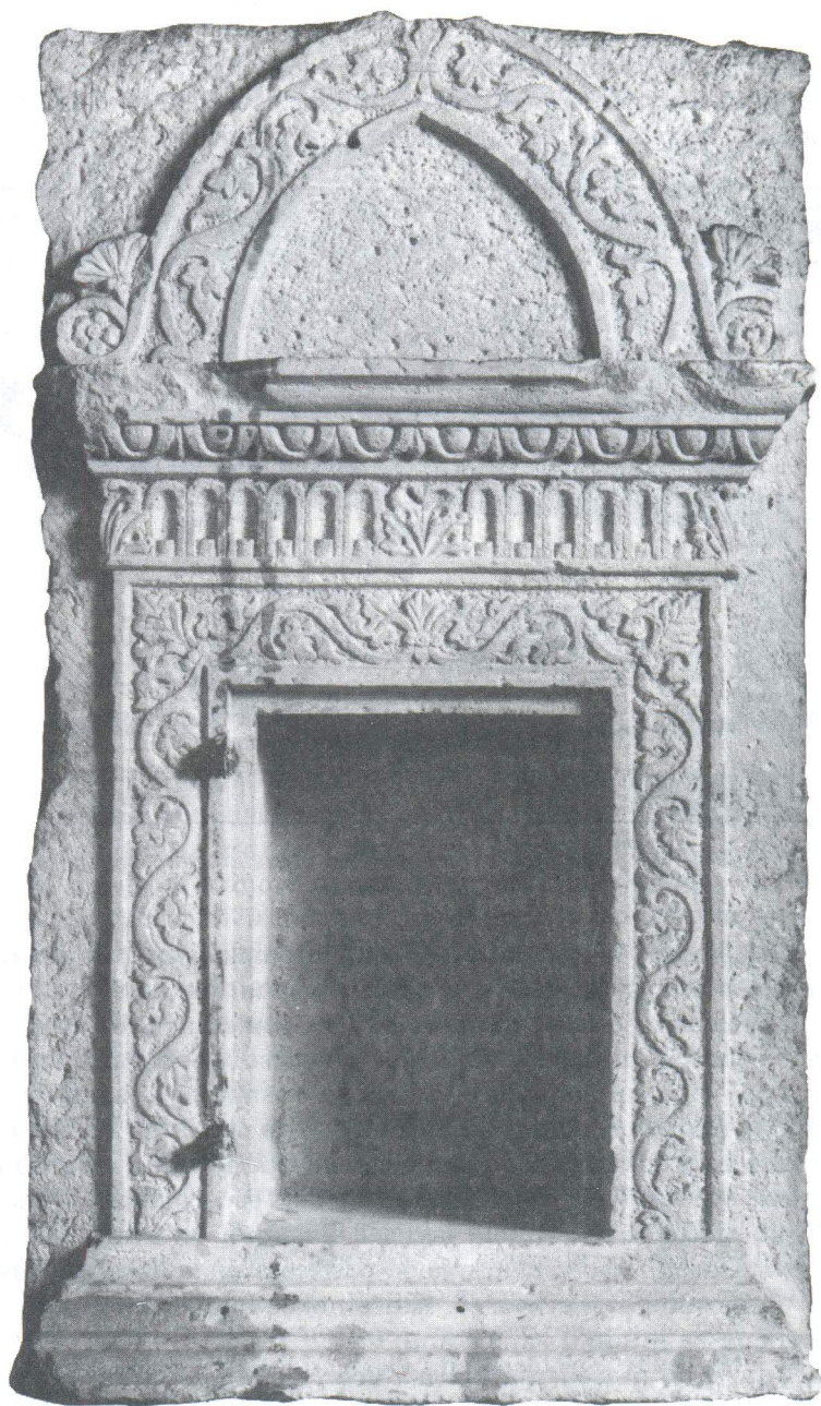
Kamena kustodija iz crkve sv. Andrije de Fenestris.