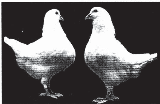
Slika 2. - MLADI TOVLJENICI PASMINE KING U DOBI OD 28 DANA

KING: Uzgojen je 1891. godine u SAD križanjem golubova bijelog perja više pasmina (pismoša, maltezer, rimski golub i dr.). Mužjaci komercijalnog kinga postižu 850 g, ženke 750 g, a mladi za klanje 550 g žive vage.