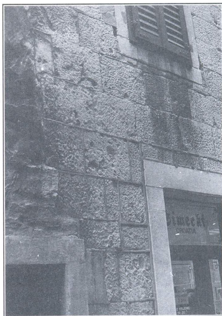
Zgrada broj 11 (na karti)

Pregled pročelja ograničio sam na povijesnu jezgru Splita (vidi kartu) gdje je označen ukupno 21 objekat čija su pročelja djelomično ili cjelovito obrađena plastično istaknutim vrpcama morta. Veličina oznake na karti svjedoči o dužini pročelja na kojemu je do danas sačuvana