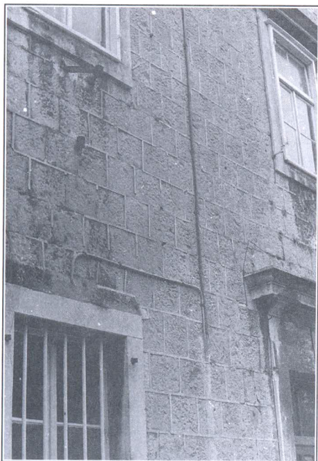
Plastično istaknute vrpce morta na pročelju Obrtničke škole u Splitu

Izvlačenje plastično istaknutih vrpca morta na spojevima kamenih blokova u zidu, odnosno imitacija kamenim kvaderima, pojavila se u Rimu krajem 3. stoljeća nakon Krista. U Dalmaciji je ovakva obrada pročelja, sudeći prema primjeru