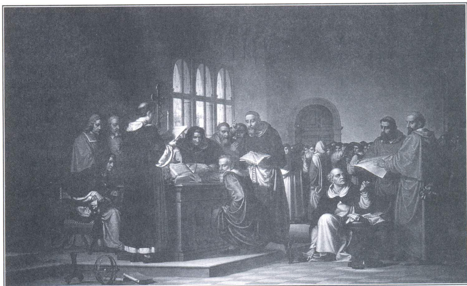
Ivan Skvarčina, Odricanje Galileja , Venecija, Scuola dalmata dei SS. Giorgio e Trifone

je slika uokvirena i svečano postavljena u velikoj dvorani bratovštine. 8) Nakon restauratorskog zahvata to golemo platno s likovima Galilea koji se odriče, inkvi-