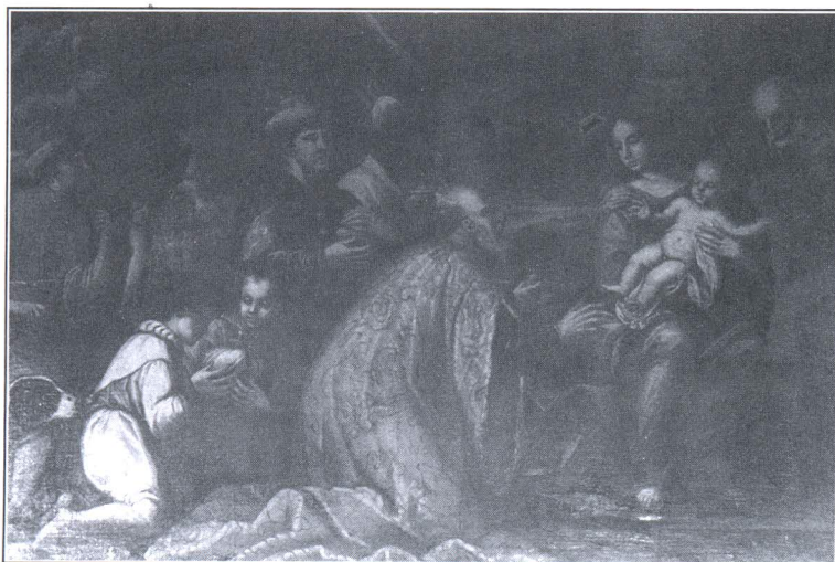
Antonio Garzadori, Poklon mudraca , Split, crkva sv. Filipa

istog sveca po projektu Francesca Melchiorija, arhitekta koji je poput Garzadorija bio iz Vicenze. Riječ je o venecijanskom vojnom arhitektu i inženjeru, prisutnom u kasnobaroknoj arhitekturi Dalmacije od Sinja do Makarske i Skradina. U Skradinu je podigao novu katedralu.